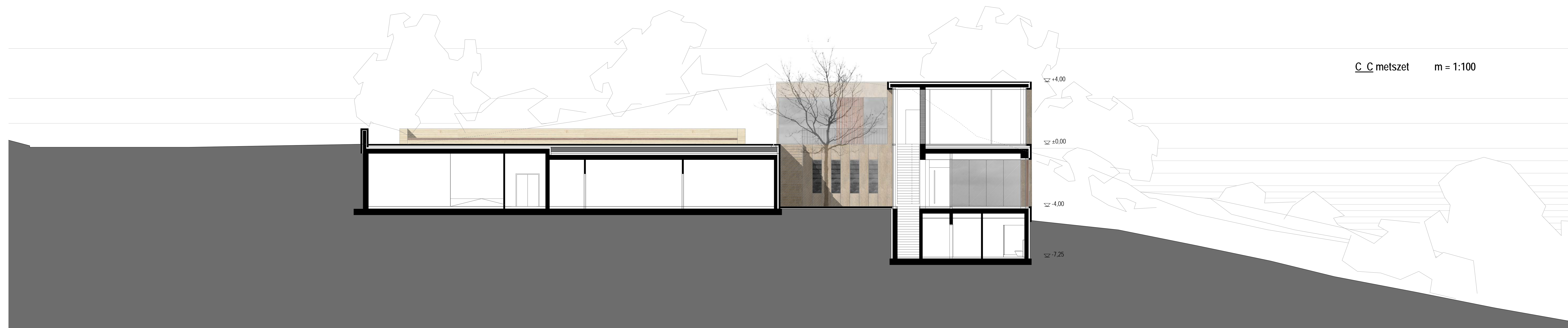
C-C metszet m = 1:100