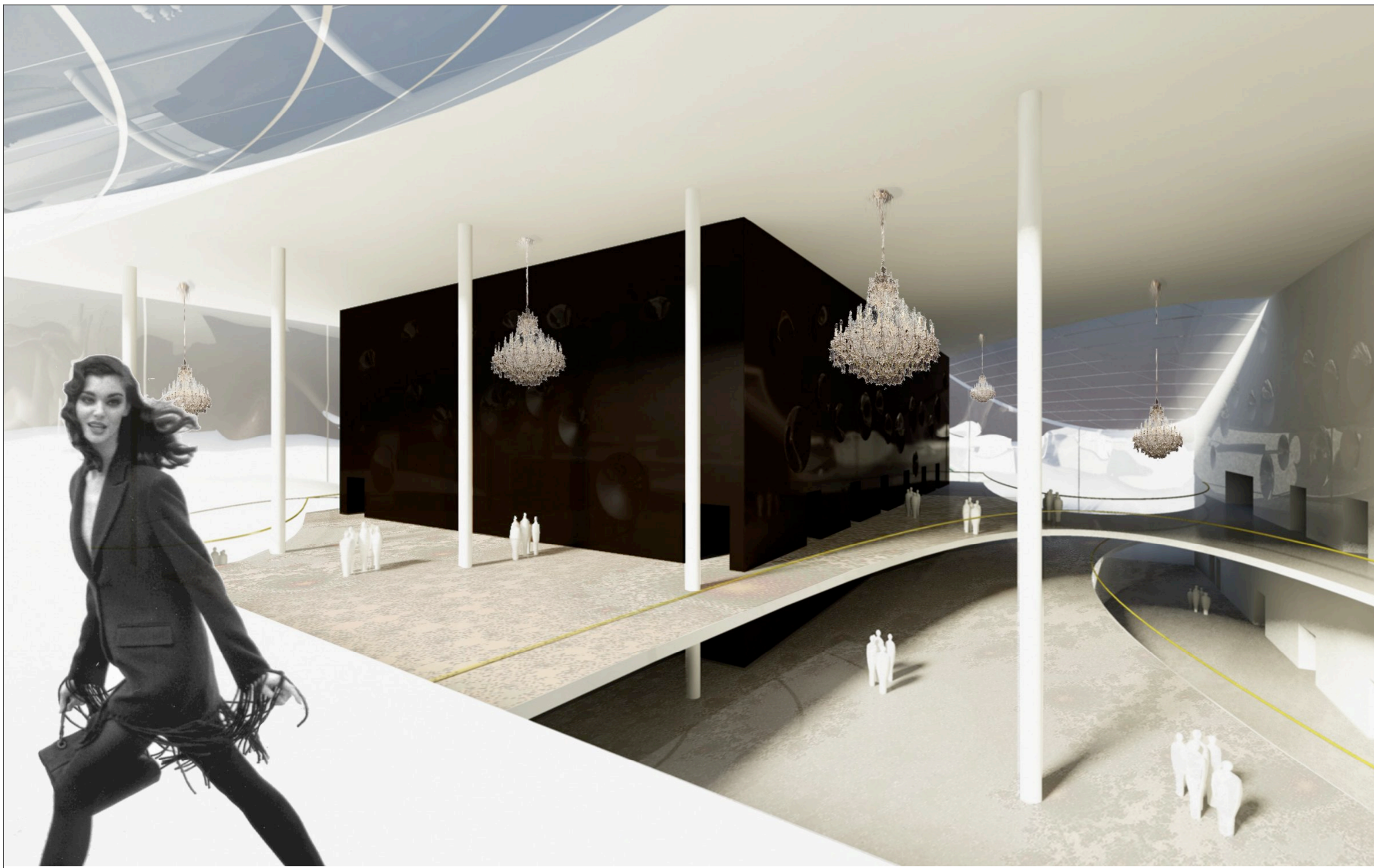
I.emeleti alaprajz m 1:200 pécsi koncert - és konferenciaközpont