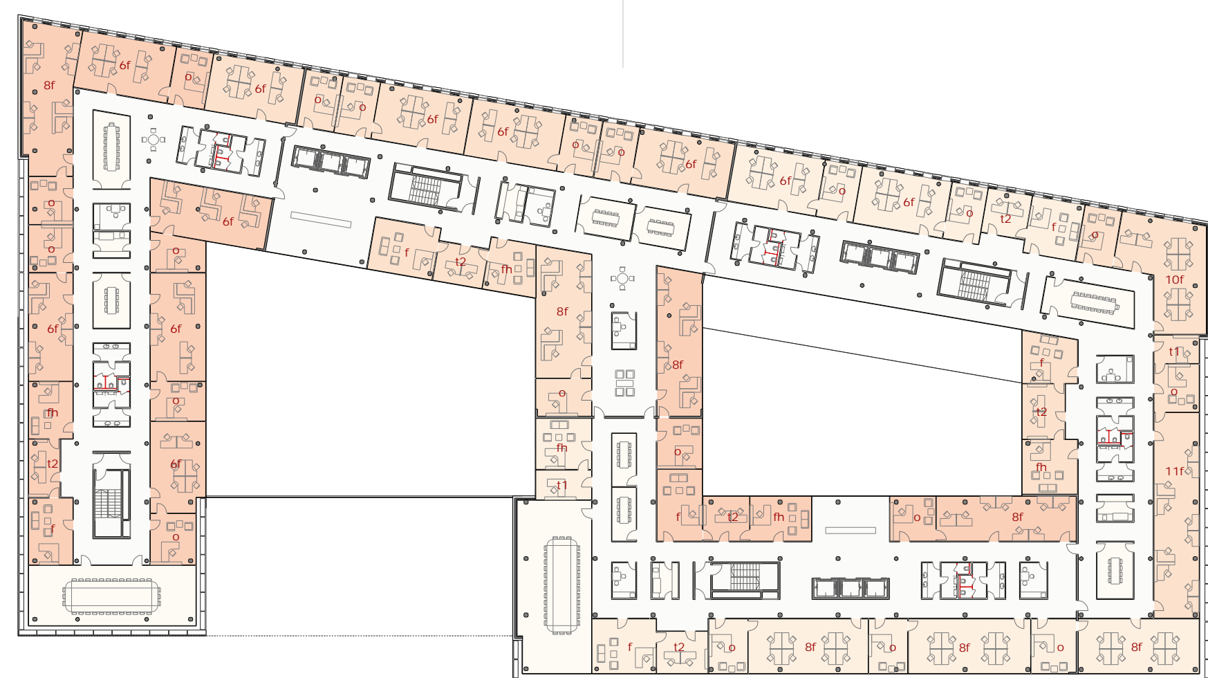
IGAZSÁGÜGYI ÉS RENDESZETI MINISZTERIUM