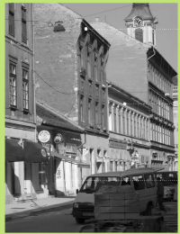
Király utca 44. sz. műemleki védettségű földszint + 2 emeletes épület, parkánymagasság: 13,30 m