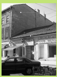
Király utca 46. sz. tervezési terület, bontásra itelt földszintes épület, a hátsó udvarban könnyeszerkezetes autószerelő műhely csarnoka található