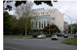
7. Mecsek Áruház