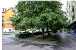
5. Építők útja utcarészlet