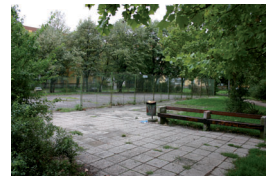
11. Szilárd Leó park, sportpálya