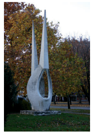
12. Meglévő műalkotás