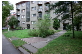
1. Ybl Miklós u. páratlan oldal

A tervezési terület alapvetően sok jó adottsággal rendelkezik, mind a növényállomány, mind a téralakítási lehetőségek tekintetében. Az épületállomány felújításra szorul, sok a vizuálisan zavaró tényező. A mai napig nem fogalmazódott meg egy konkrét fejlesztési irányvonal, amelynek mentén a városrész újra élhetővé és „élővé” válhatna.