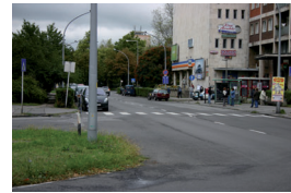
3. Posta előtti utcaszakasz