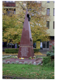
4. Repülő halottak emlékműve