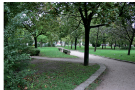
10. Szilárd Leó park részlete