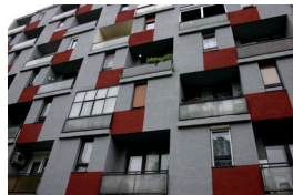
9. Uránbányász téri homlokzat