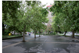
6. Uránbányász tér, platánfák