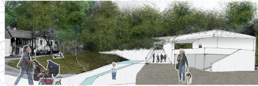
+ Tettye tér és kaszkád látványa