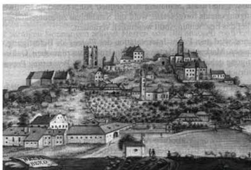
Brennbach 1821, aus: Boos, S. 123