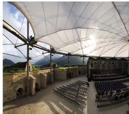
Kugel+Rein Architekten, Stuttgart, 2006

A használat és az új funkció természetesen egy sor új fejlesztést is igényelt. Az évtizedek óta népszerű fesztivál helyszín fejlesztéseként készült a József-bástya könnyűszerkezetes lefedése, mely célszerűségével, egyszerű szerkesztésével a hely XXI. századi jelképévé válhat.