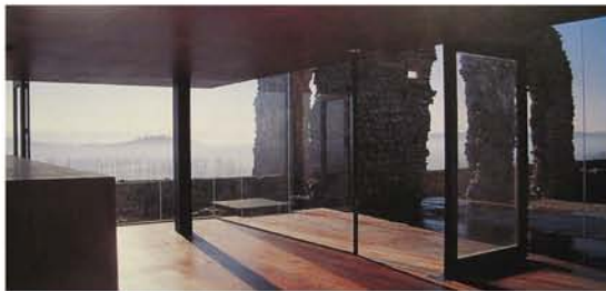
Építész: Joao Mendes Ribeiro, Coimbra, 2002