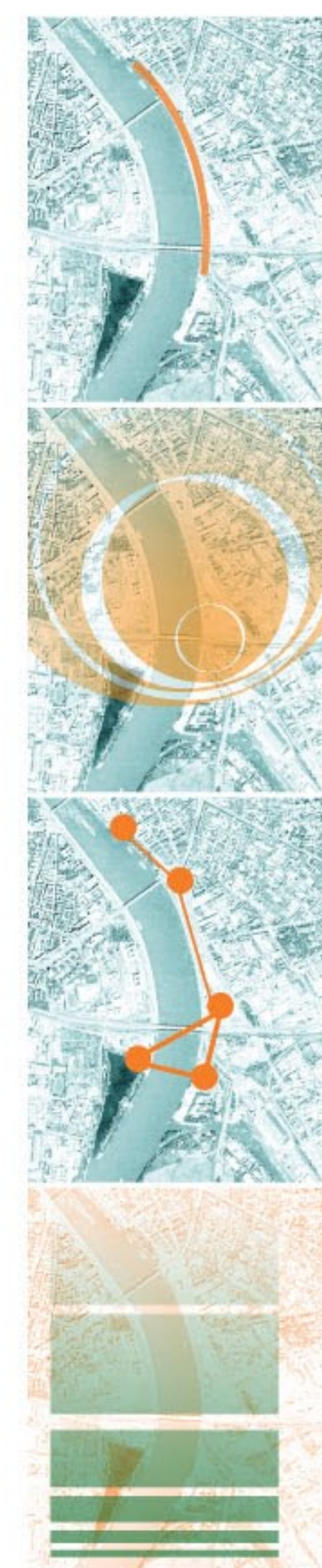
Parti sétány amely nem elszakítva a Dunától