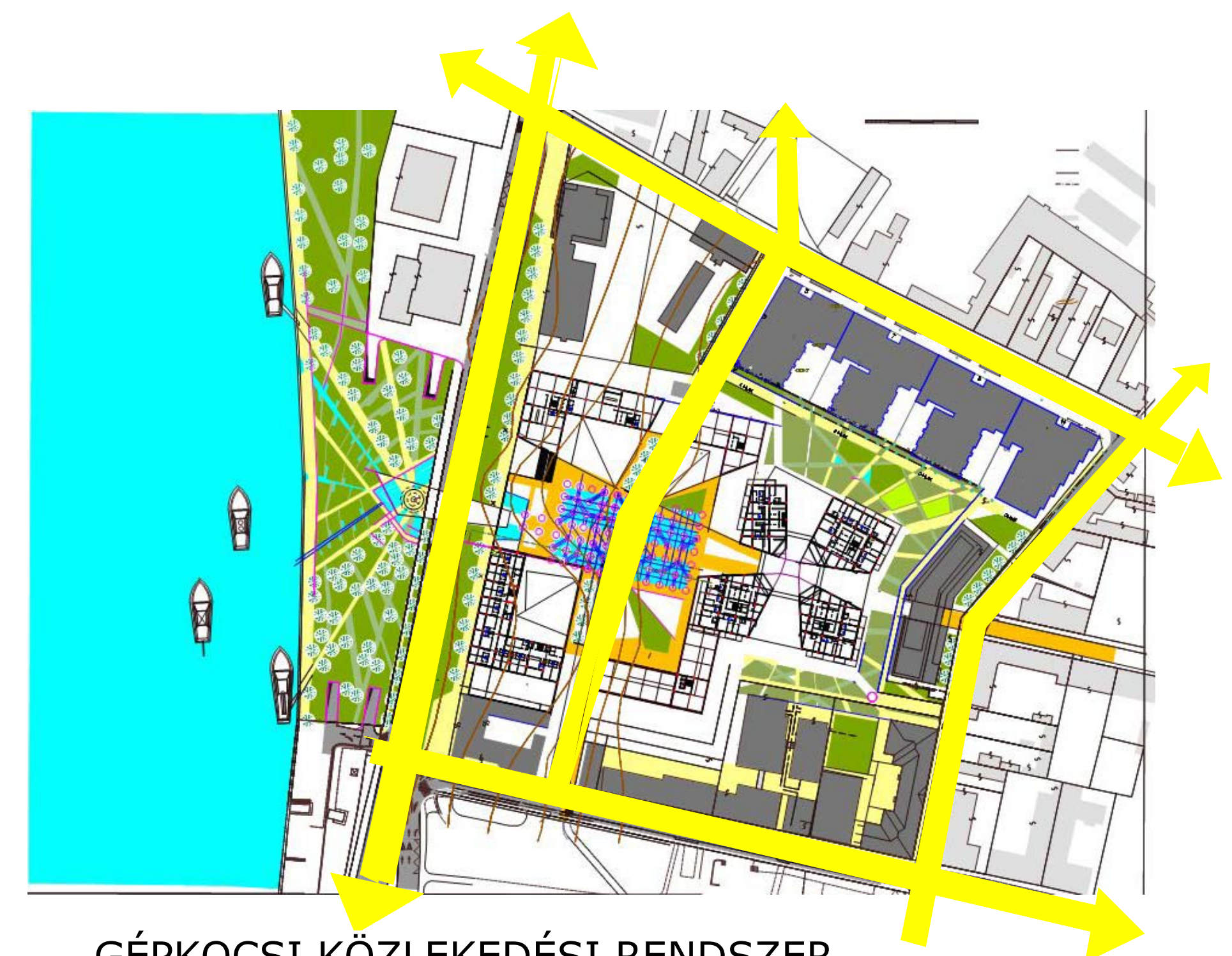
GÉPKOCSI KÖZLEKEDÉSI RENDSZER