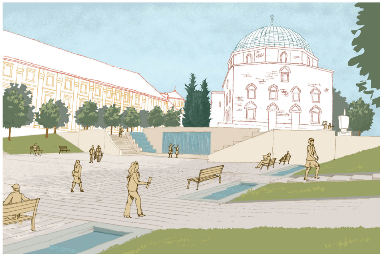
A Városház tér küllő terasza nézet M=1:100