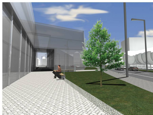
Kálmán utca 8., gyalogos tengely