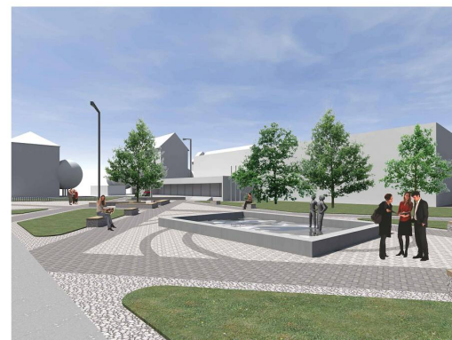
Mórícz Zsigmond tér, Általános Iskola