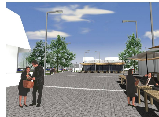
Domus tér, Mutatványosok tere