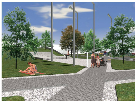
Domus park, szabadterti színpad

Elemelve a vasútállomás és környezetének mai helyzetét és működését, azt látjuk, hogy szinte kizárólag a közlekedési mód váltása az egyetlen funkciója. Néhány kisebb üzletet és szolgáltatást leszámítva a közeli intézmények többsége igazgatási és oktatási létesítmény. A tér léptékét a vasút felvételi, igazgatási és szállásépülete határozza meg, ezek azonban nem alkotnak zárt egységet, a szabadon maradó területek mind az északi mint a keleti térfalon foghíjaként jelennek meg. Az állomás előtere autóbusz forgalommal kitöltött, ez nem teszi lehetővé a beépítés körbezárását és újabb funkciók elhelyezését.