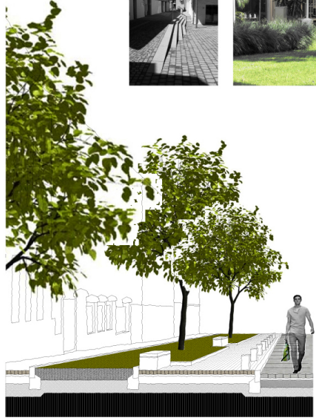
Egyetem utca - térbeli metszet