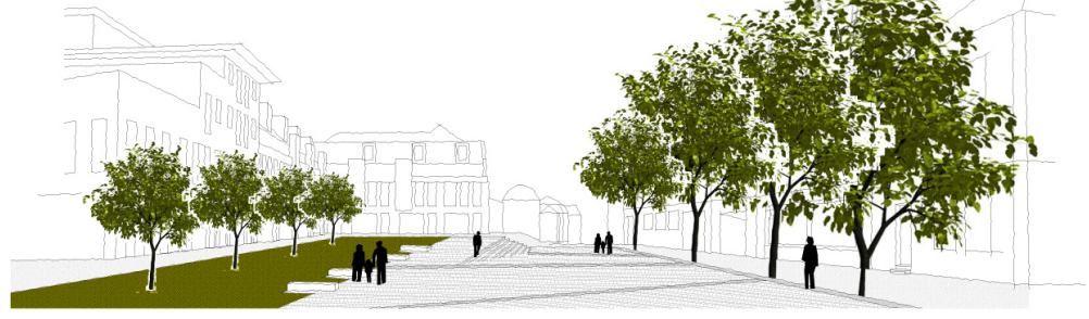
Vasarely tér - látványterv