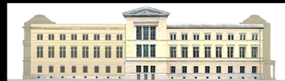
David Chipperfield berlini Neues Museumának homlokzati tervei