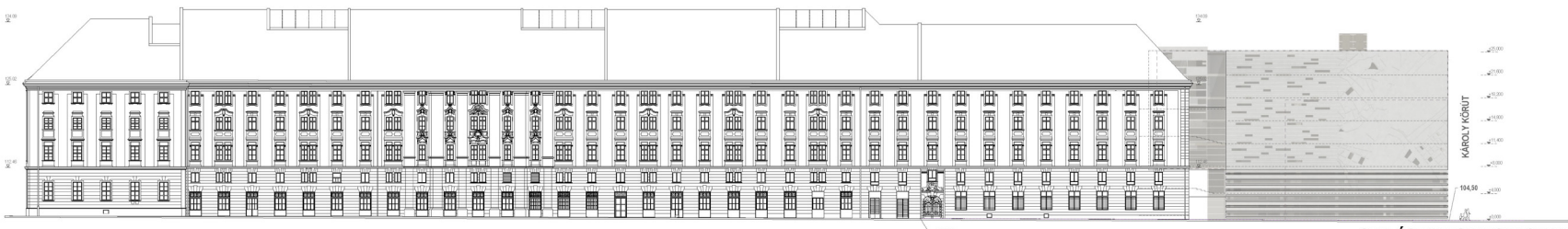
GERLŐCZY UTCAI HOMLOKZAT