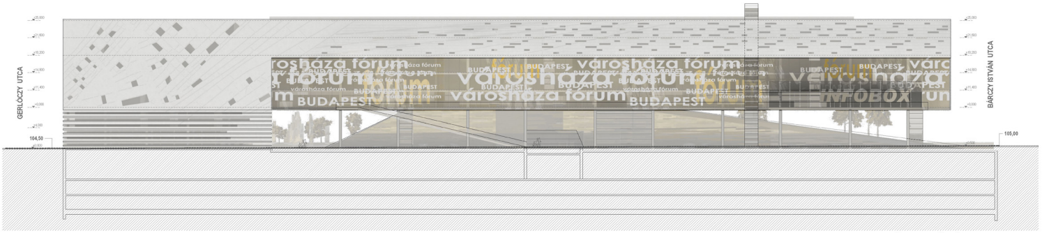
KÁROLY KÖRÜTI HOMLOKZAT