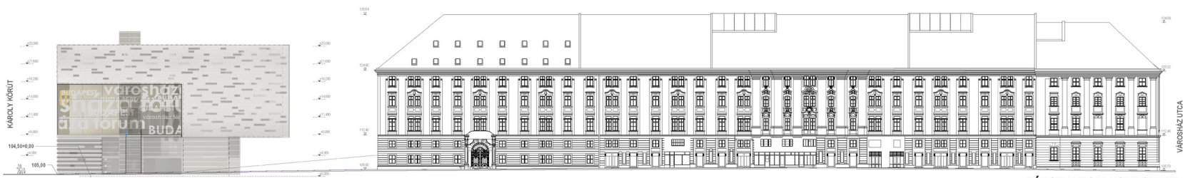
BÁRCZY UTCAI HOMLOKZAT

A METSZET AZT A TÉRSTRUKTÚRÁT MUTATJA BE, AMELY A RÉGI ÉS A TERVEZETT ÉPÜLETEK, UDVAROK, FÓRUMOK” SZERVES, EGYÜTTMŰKÖDŐ KAPCSOLATRENDSZERÉBŐL ÁLL ÖSSZE. AZ EGYÜTTES MEGHATÁROZÓ RÉSZÉ A KÁROLY KÖRÜTRÉ NÉZŐ FORUM („NAGY SZÍNPAD”) – A FÖLÉ LEBEGŐ KONZOLOS VÁROSHÁZA – BÉRIRODAHÁZ (ÁTSZELLŐZTETETT ZÖLD UDVARAIVAL), AZ ÜDVAR NAGY LEJTŐS PLATÓJA (A NÉZŐTÉR);- A KERESKEDELEM TEREI, A KULTURÁLIS KÖZPONT (AMELYRE A PLATÓ FELVEZET).