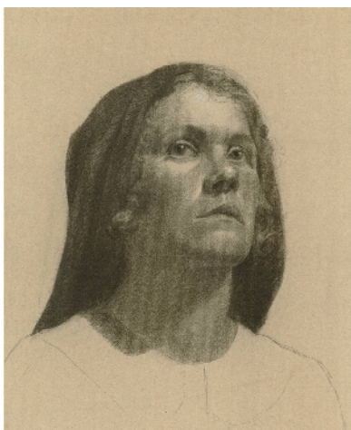
Képzőművészeti Főiskolán készült grafika