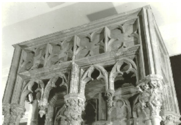
Visegrád, Anjou falikút felső része