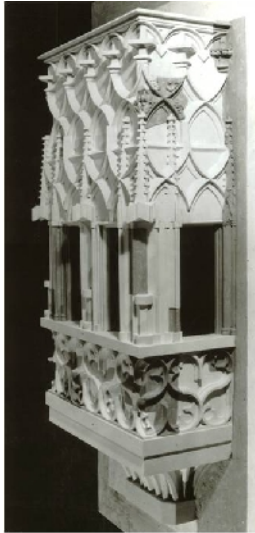
Siklós, Vár, gótikus erkély gipsz modellje