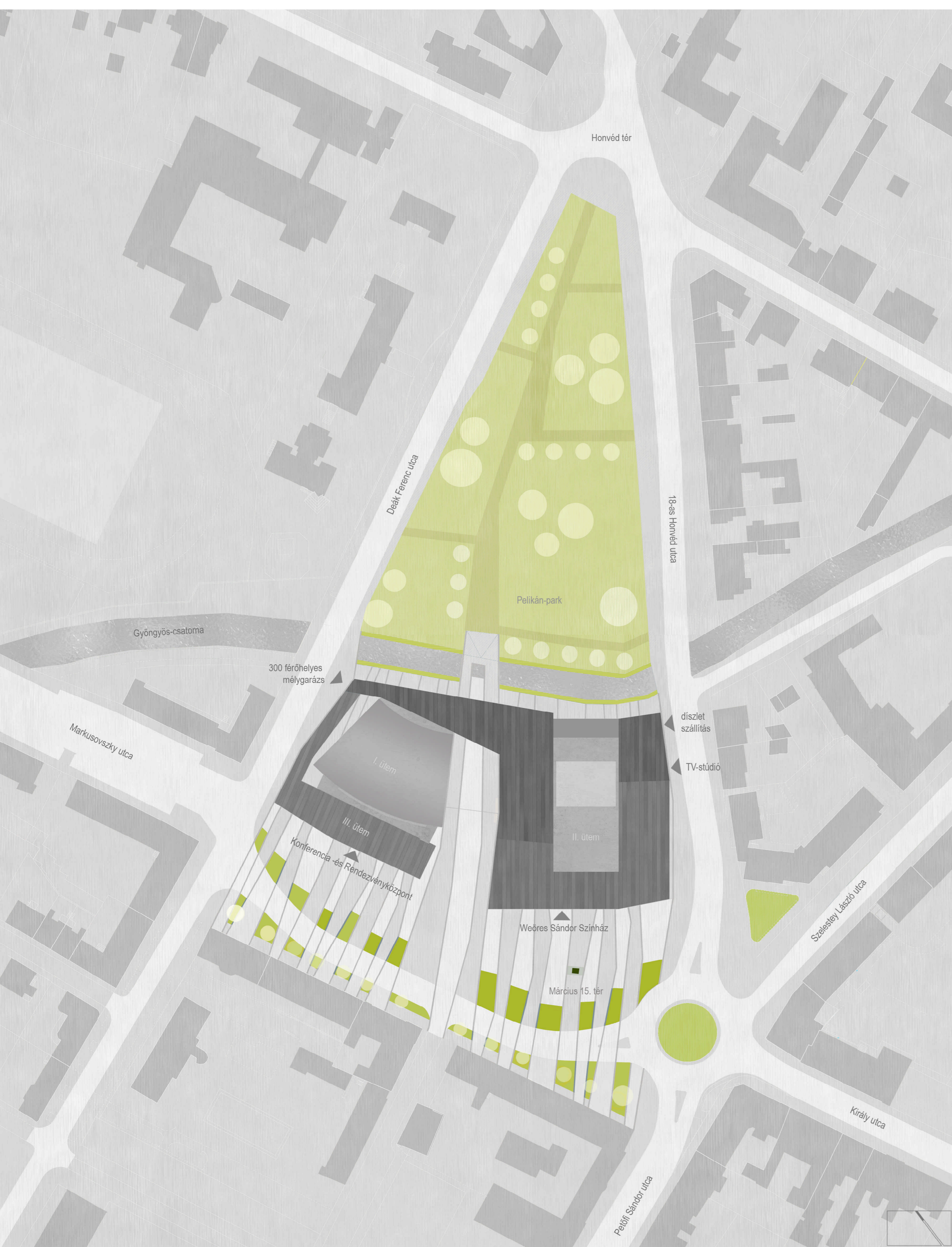
HELYSZÍNRAJZ M 1 : 1 0 0 0