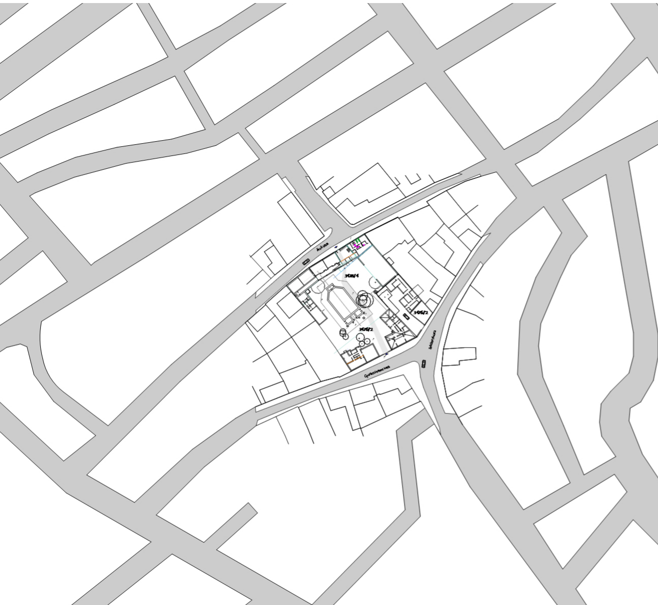
1. városszerkezeti összefüggések

Pápa belvárosának egy sajátossága, hogy a sétáló utcára a Kossuth Lajos utcára merőlegesen hosszú keskeny tömbök alakultak ki, amelyek közé a Lutheránus szigetet tartalmazó is tartozik, s e tömböket hozzávetőlegesen súlyvonalukban – egy helyi sajátosságként „közle-k”-nek nevezett – közök szelik át, amelyek a sétáló utcával párhuzamos átjárhatóságot biztosítanak a Kis kard utcától a Széchenyi útig. Tömbünkön belül a Lutheránus sziget mintegy érkezési pontja e közök rendszerének. Maga a Lutheránus sziget így egy speciális helyet foglal el a városszerkezeten belül, hiszen „tömbjében” nem csak lakó, hanem középületek – elsősorban maga a templom – is elhelyezkednek, s így megközelítésük - legalábbis meghatározott csoportok számára – kiemelt fontossággal bír.