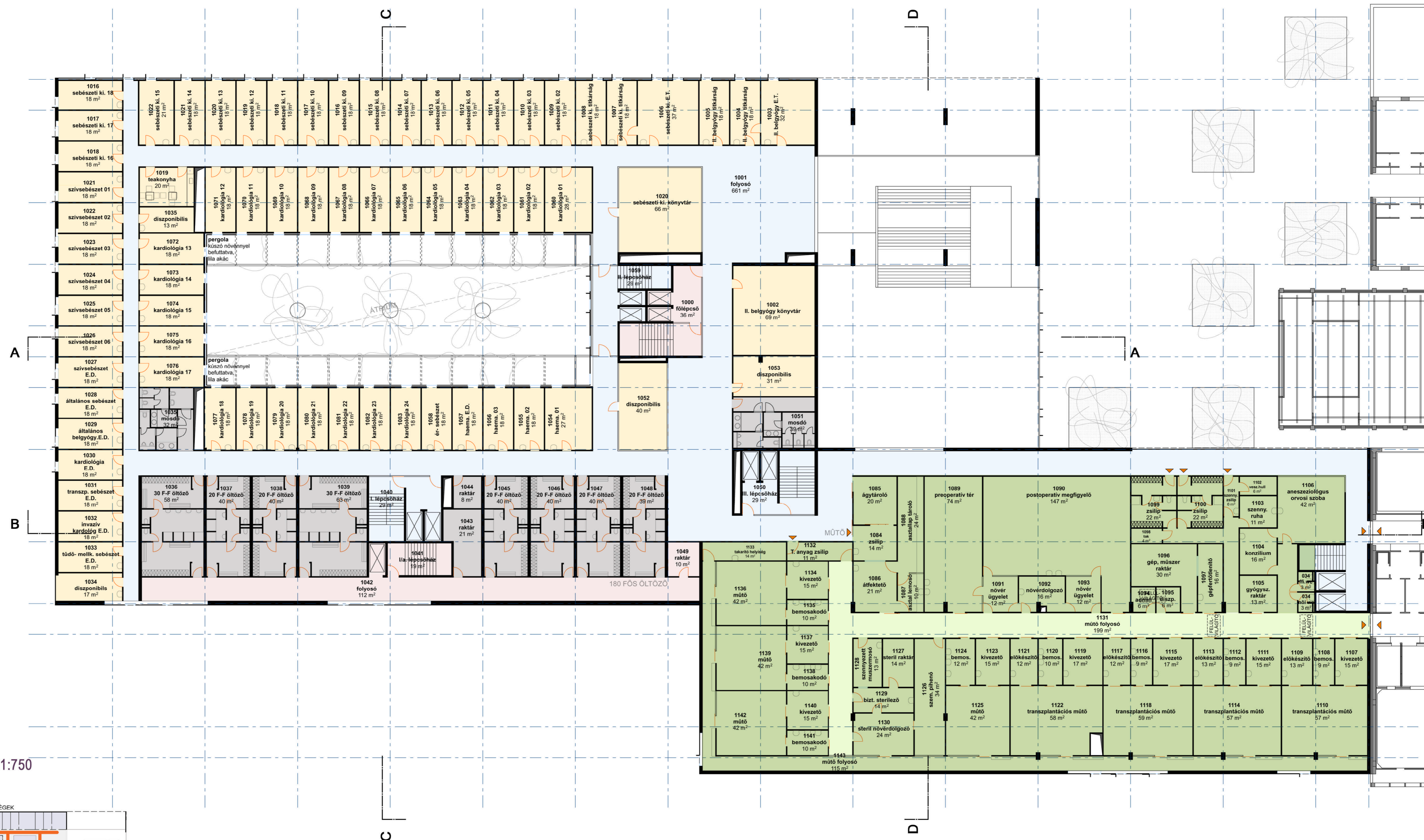
ÚTVONAL DIAGRAM M1:750