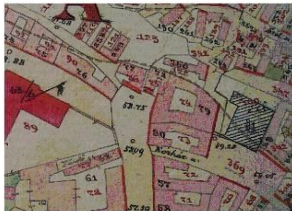
- Kataszteri térkép, 1886. (KEML) A tervbe vett / épülőfélben lévő (?) Baumhorn-féle zsinagóga 81/82. szám alatt.