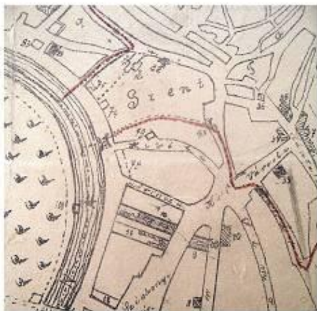
- Városterkép részlete 1883. (KEML) 36-os szám m aljelölve a korabali zsinagóga.