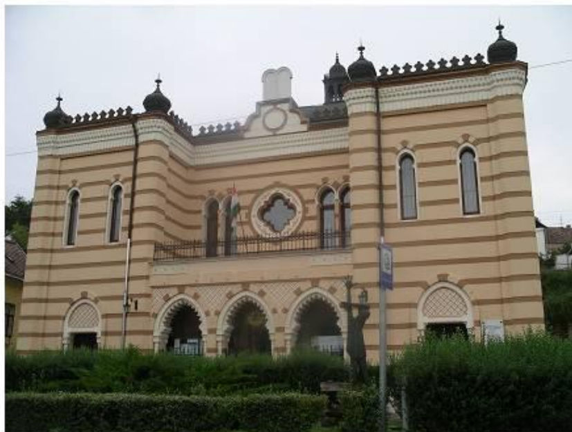
A zsinagóga főhomlokzata 2008 szeptemberében

Jelen szakvéleményt a König és Wagner Építésszek Kft. megbízásából 2008. szeptember folyamán készítettem. A kutatás és a tanulmány célja a zsinagóga főbb építéstörténeti adatainak ismertetése, a feltétlenül megőrzendő műemléki értékek felsorolása, továbbá az építészeti programterv ismeretében a további kutatások, megfigyelések, esetleges beavatkozások jelzése, amennyiben lehetséges, azok költségvetésének feltűntetésével.