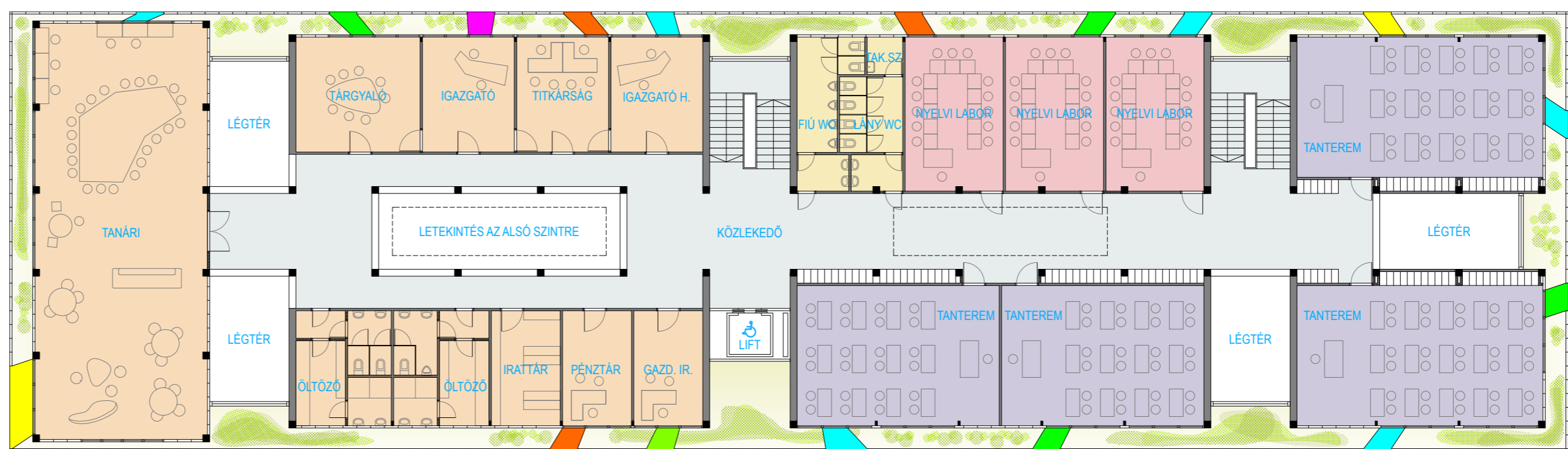
3. EMELETI ALAPRAJZ 1/200

A tanári / adminisztrációs helyiségek az iskolaépület déli szárnyának 3. emeletén kaptak helyet. Az igazgatóság helyiségei a bejárat felé kerültek, a tanári pihenőből széles rálátás nyílik az iskolaudvarra. A tanári pihenő nagyobb a kiírásban kértnél, így a társadalomtudományi, idegennyelvi, rajz / földrajz pedagógusok munkahelye is kialakítható benne. A tanári szárny közlekedőjét felnyitottuk a második emelet felé, közvetlenebb kapcsolatot biztosítva az iskola vérkeringésébe.