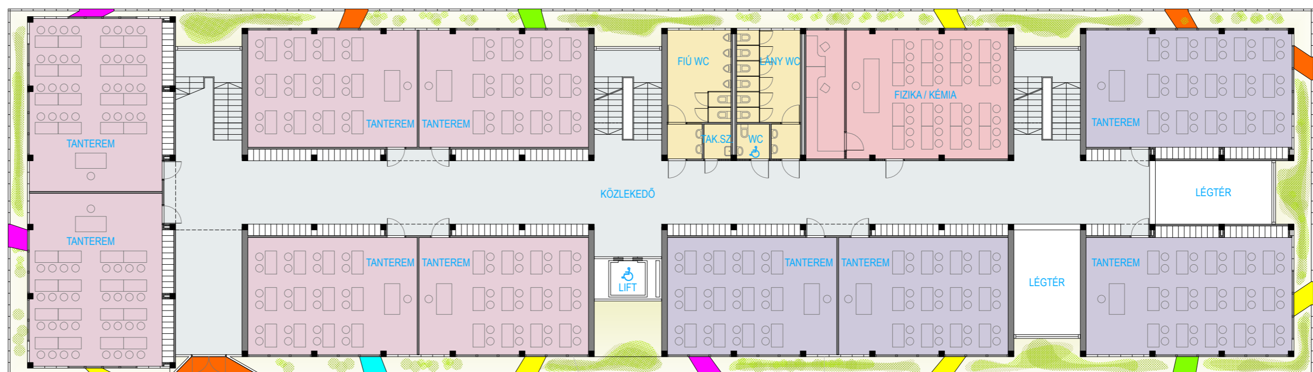
1. EMELETI ALAPRAJZ 1/200