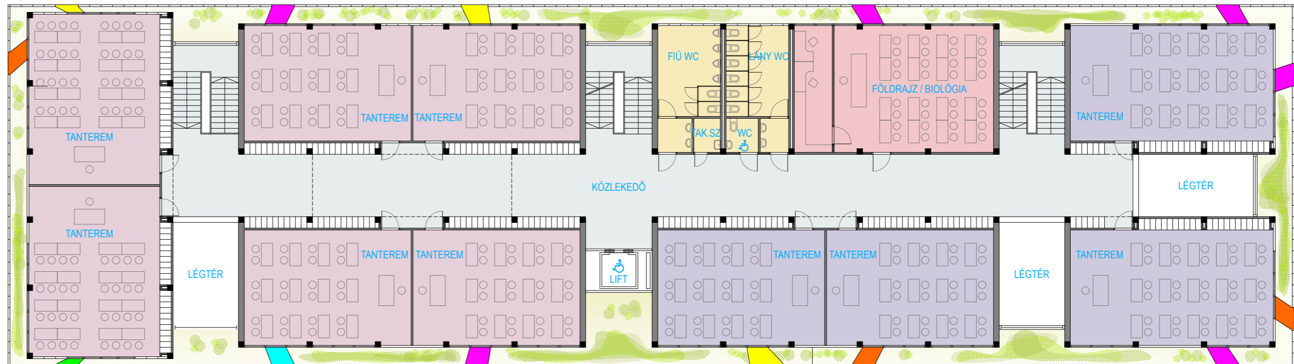
2. EMELETI ALAPRAJZ 1/200