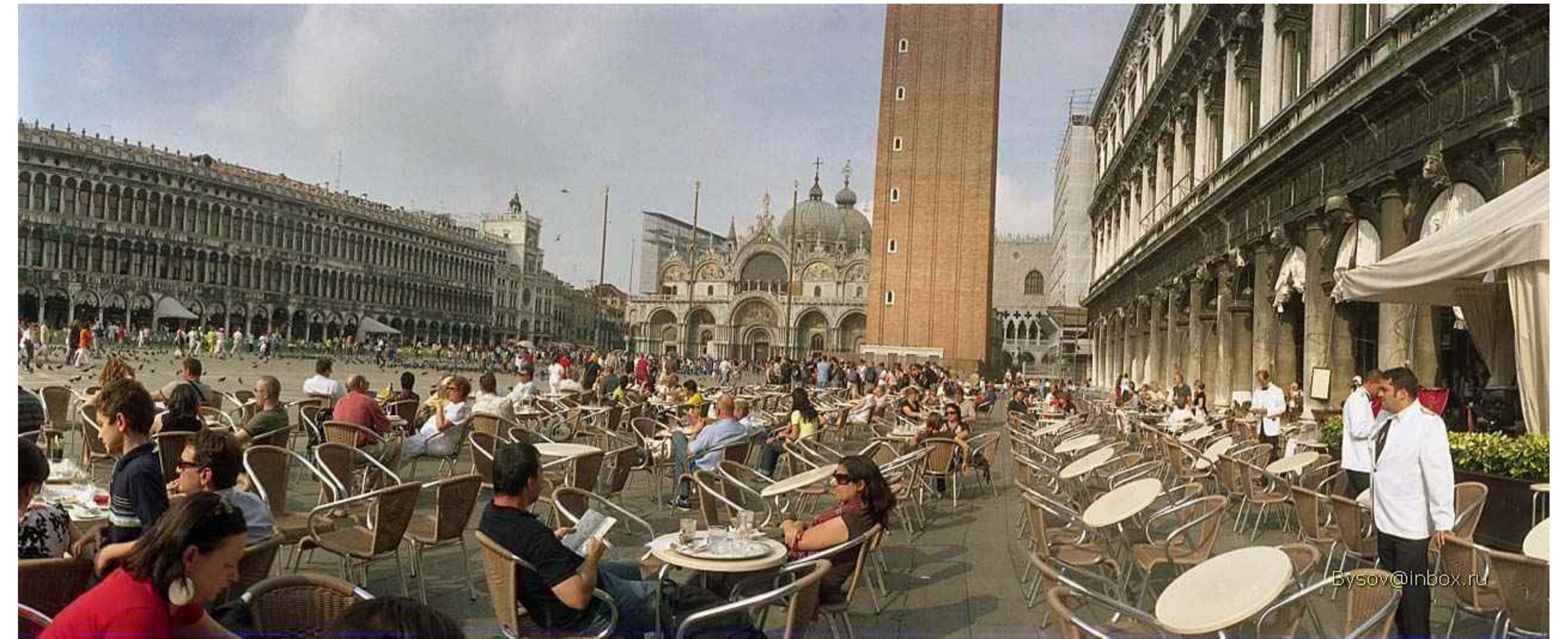
A tér akkor él ha használják