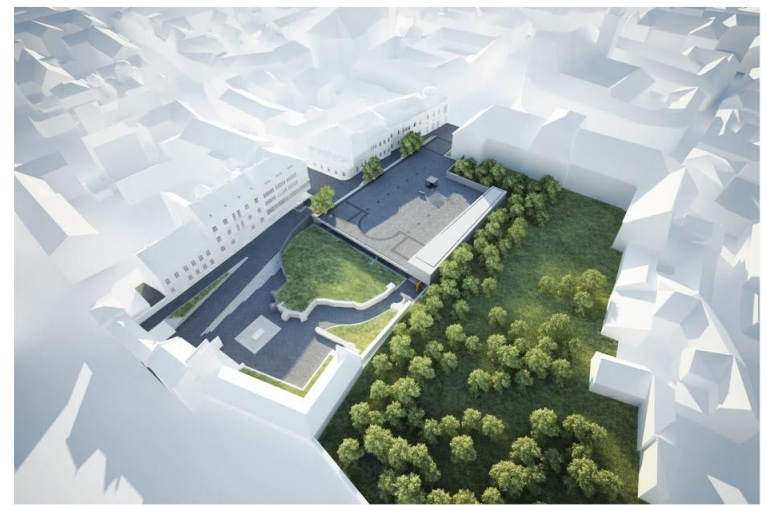
Távlati kép észak felől