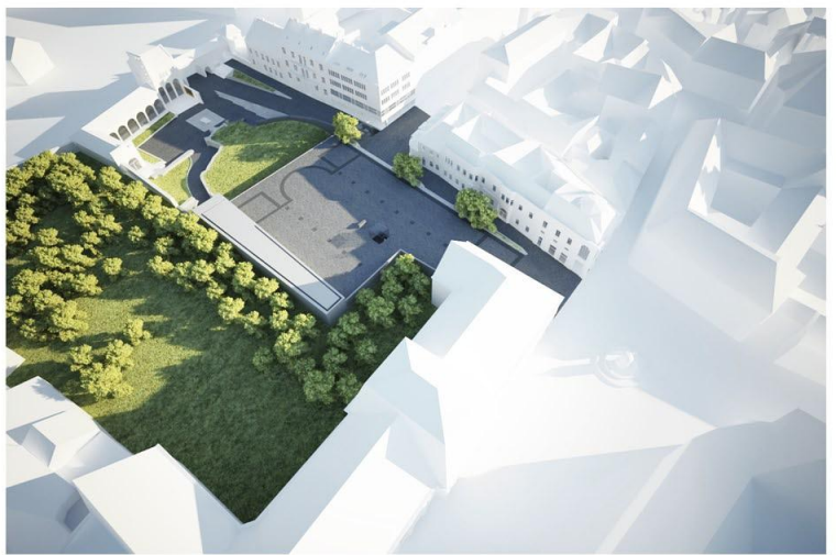
Távlati kép nyugat felől