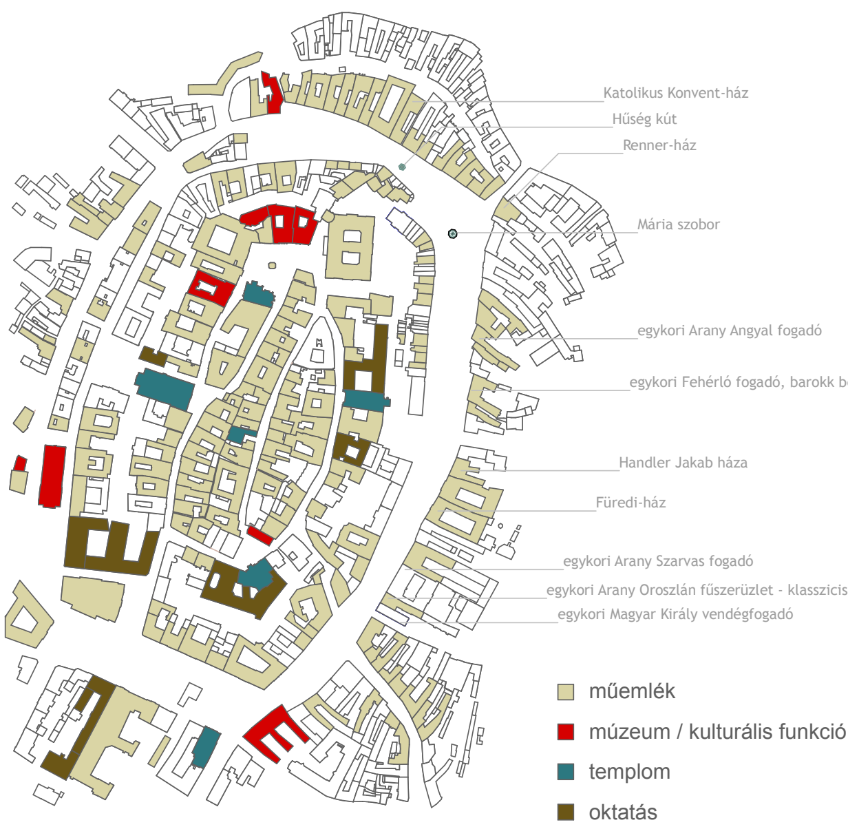
01. ábra: műemlékek, kulturális súlypontok

Úgy is tekinthetünk a Várkerület hosszú térsorára, mint egy évszázadok óta folyamatosan iródó, folyamatosan gazdagodó zenei költeményre, amelyben a különböző színek gyönyörű harmóniákban szövédnék egybe. A Várkerület jövőbeni arculatának kialakításánál hasznos analógia lehet a többszólamú zene, melynek néhány halhatatlan mestere, mint Liszt Ferenc és Joseph Haydn maga is megfordult ezen a helyen. Munkánk során elsősorban az építészeti rétegek (színek) elemzésére és a szükséges beavatkozások meghatározására koncentráltunk. A térsor újragondolásának kiindulópontja a forgalomtól megszabadított, üres, gondolatban egységesen burkolt tér, a megtartásra érdemes növényzetet.