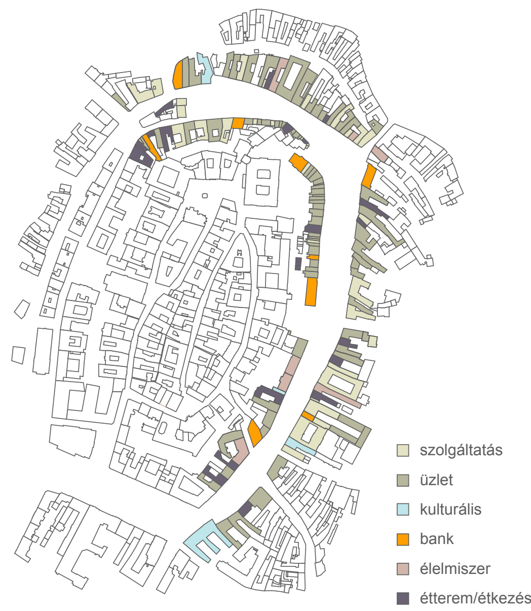
02. ábra: Várkerület jelenlegi funkciói