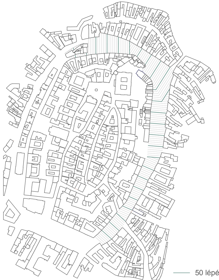
06. ábra: „alaprítmus”