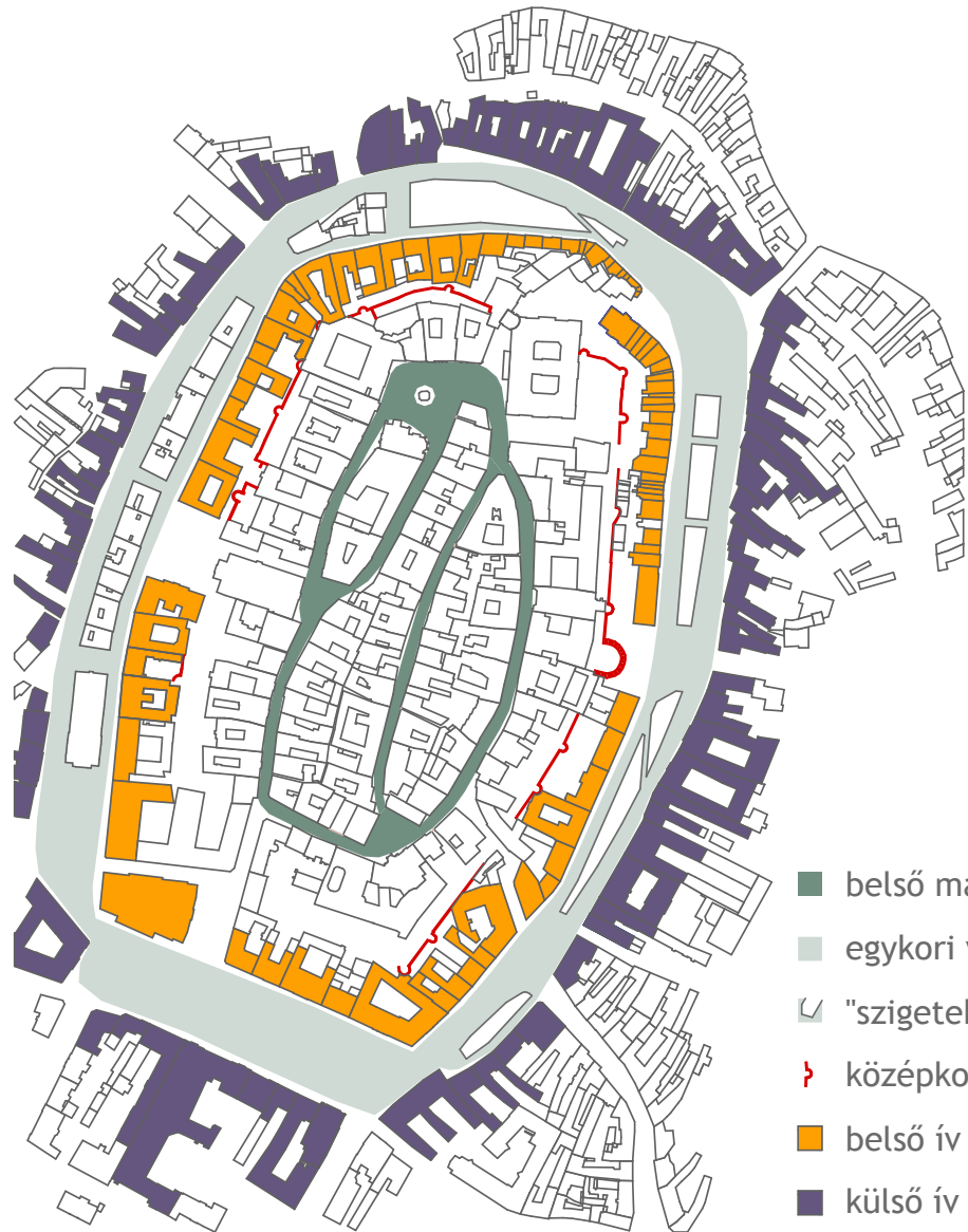
04. ábra: gyűrűs felépítés

A gyalogosforgalmi koncepció fontos eleme az alaprítmus: az újonnan burkolt terek burkolatait harántcsíkos rendszerben alakítottuk ki (06. ábra): A burkolatosztás fontosabb határvonalait 50 lépésenként, 31 méterenként alakítottuk ki (50lépés x 62cm átlagos lépéshossz = 31m). Ez az osztásrend megadja a Várkerület zenéjének alaprítmusát és érzékelhetővé, mérhetővé teszi a távolságokat, ami egy élvezhető adalék a gyalogosok számára. A Várkerület hossza: kb. 1150 lépés.