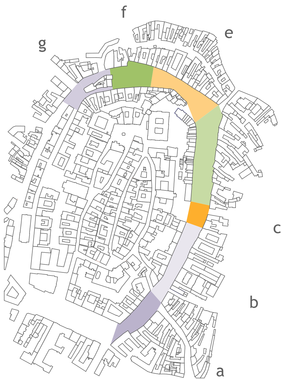
14. ábra: ütemezés