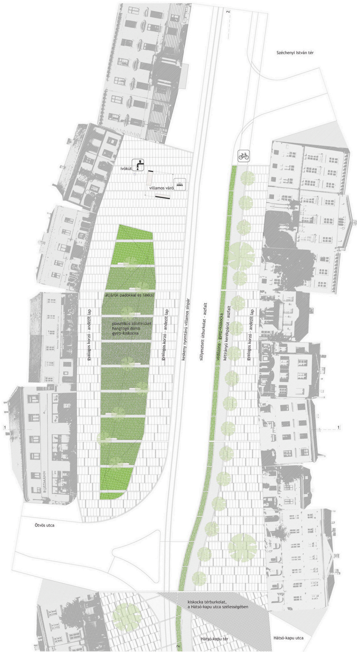
SZÉNA-PIAC TÉR ALAPRAJZ, UTCANÉZETEK