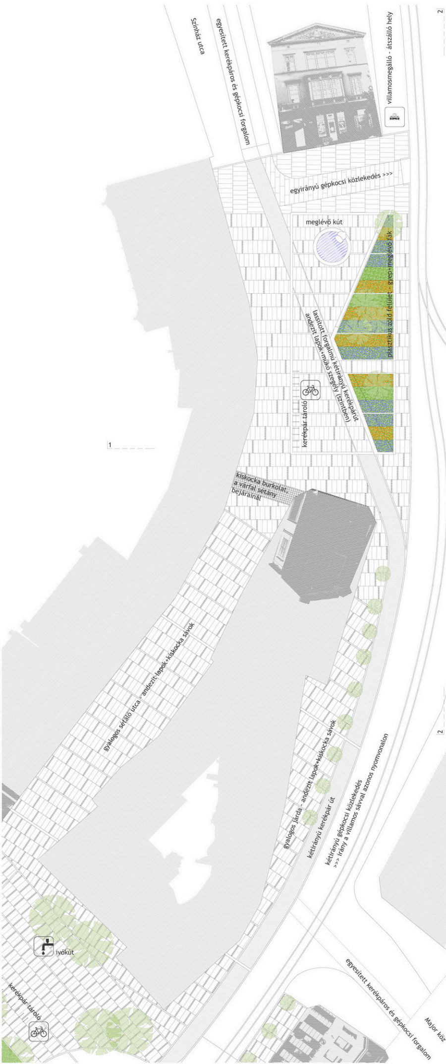
ÓGABONA TÉR ALAPRAJZ, UTCAKÉPEK