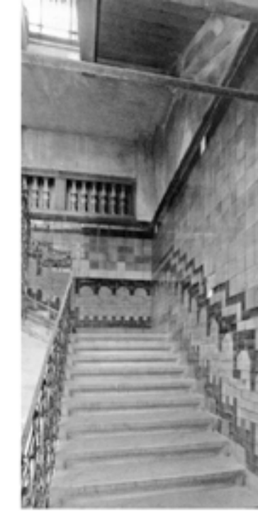
A FÜRDŐHÖZ TARTOZÓ LÉPCSŐ