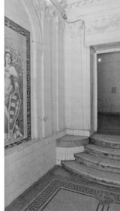
NYÁR UTCA 7 A FÜRDŐRE EMLÉKEZTETŐ ELŐTÉR