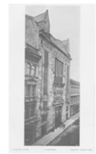
HUNGÁRIA USZODA SZECSESSZIÓS ÉPÜLETE