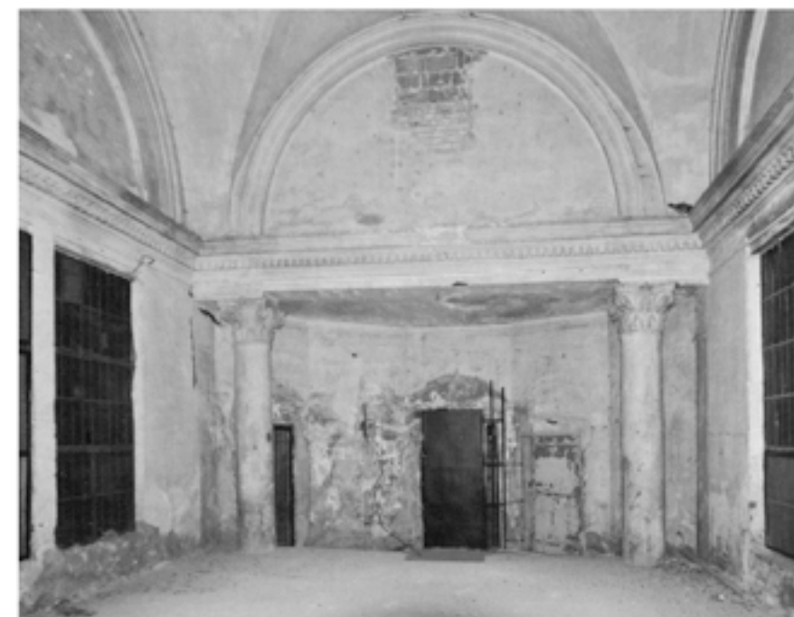
EGYKOR MEDENCE VOLT, MAJDN ZENEPÓDIUM

HELYSZÍN: BUDAPEST BELVÁROS, VII. KERÜLET KLAUZÁL UTCA. A RÉGI HUNGÁRIA FÜRDŐ TERÜLETÉNEK EGYIK FOGHÍJA. A KÖRNYÉK FOLYAMATOSAN ÉPÜL, A HATÁROS ÉPÜLETEK LEGTÖBBJE BONTÁSRA VAN ÍTELVE A MŰEMLEKI RÉSZ FELÚJÍTÁSÁVAL, KONZERVÁCIÓVAL. A JELENLEG ÜRES TELEKRE EGY FÜRDŐ ÉS SZÁLLODA EGYÜTTESIT TERVEZNEK TOVÁBBI TELKEK ÖSSZEVONÁSÁVAL, A HÁROM TELKEK EGYIKÉNT TALÁLHATÓ A HUNGÁRIA FÜRDŐ AGOSTON EML. ÁLTAL TERVEZETT SZECSESSZIÓS USZODÁJÁNAK MŰEMLEKI HOMLOKZATA ÉS ÉPÜLETSZÁRNYA. A TERVEZÉSI TERÜLET- A KLAUZÁL UTCA 8. SZÁMÚ TELEK -VALAHA EGY RITUALIS NŐI FÜRDŐKÉNT SZOLGÁLT, KÉSŐBB A HUNGÁRIA FÜRDŐ NŐI RÉSZLEGÉNEK ADOTT OTTHONT, MAJDN 60 DARAB KÁDFÜRDŐT ÜZEMELTEK, AMELY RÉSZE VOLT A KOMPLEXUMA HATALMAS BLOKKJÁNAK. A HÁBORÚ UTÁN EGY KÖNYVKIADÓ VÁLLALAT NYITTA MEG KAPUIT, MELYET MOSTANRA MÁR LE-BONTOTTAK. A FOGHÍJAT EGYIK OLDALROL EGY ART DECO STÍLUSBA ÉPÜLT HATEMELETES LAKÓÉPÜLET HATÁROLJA, ILLETVE A HUNGÁRIA FÜRDŐ SZECSESSZIÓS USZODÁJÁNAK A MŰEMLEKI ÉPÜLET-SZÁRNYA ÉS HOMLOKZATA. AZ ÉSZAKI OLDALON EGY BONTÁSRA ÍTELT JELENLEG LAKÓHÁZ A SZOM-SZÉDJA, MELYEN RÉGEN A HATYÚ MOSODÁT ÜZEMELTETÉK. A KARAKTERES TÉGLAKEMÉNY EHHEZ TARTOZOIT.