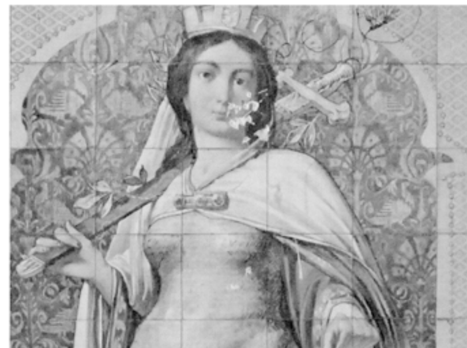
HUNGÁRIA ALLEGORIKUS ALAKJA AZ ELŐTÉR FALÁN