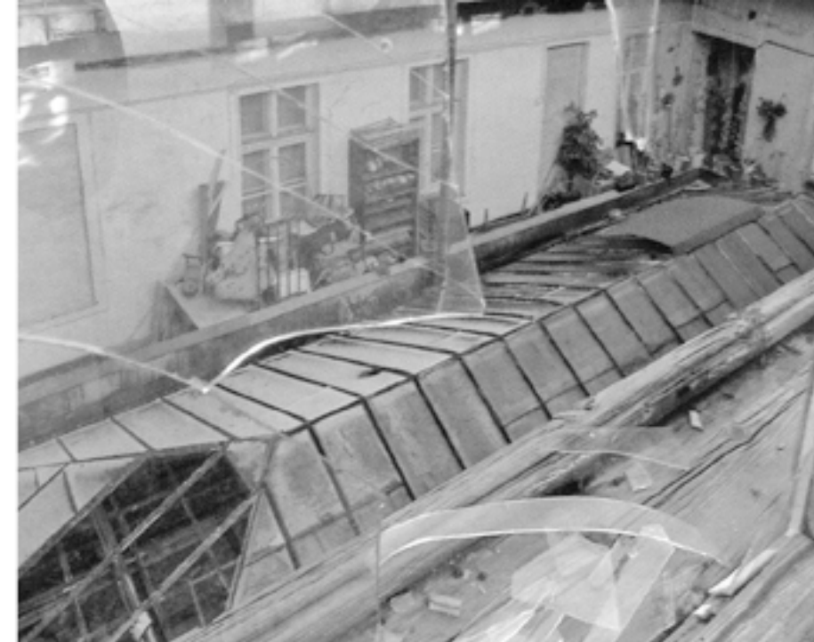
AZ ÜVEGTETŐ ALATT VOLT A HATYÚ GÓZMOSODA

HELYSZÍN: BUDAPEST BELVÁROS, VII. KERÜLET KLAUZÁL UTCA. A RÉGI HUNGÁRIA FÜRDŐ TERÜLETÉNEK EGYIK FOGHÍJA. A KÖRNYÉK FOLYAMATOSAN ÉPÜL, A HATÁROS ÉPÜLETEK LEGTÖBBJE BONTÁSRA VAN ÍTELVE A MŰEMLEKI RÉSZ FELÚJÍTÁSÁVAL, KONZERVÁCIÓVAL. A JELENLEG ÜRES TELEKRE EGY FÜRDŐ ÉS SZÁLLODA EGYÜTTESIT TERVEZNEK TOVÁBBI TELKEK ÖSSZEVONÁSÁVAL, A HÁROM TELKEK EGYIKÉNT TALÁLHATÓ A HUNGÁRIA FÜRDŐ AGOSTON EML. ÁLTAL TERVEZETT SZECSESSZIÓS USZODÁJÁNAK MŰEMLEKI HOMLOKZATA ÉS ÉPÜLETSZÁRNYA. A TERVEZÉSI TERÜLET- A KLAUZÁL UTCA 8. SZÁMÚ TELEK -VALAHA EGY RITUALIS NŐI FÜRDŐKÉNT SZOLGÁLT, KÉSŐBB A HUNGÁRIA FÜRDŐ NŐI RÉSZLEGÉNEK ADOTT OTTHONT, MAJDN 60 DARAB KÁDFÜRDŐT ÜZEMELTEK, AMELY RÉSZE VOLT A KOMPLEXUMA HATALMAS BLOKKJÁNAK. A HÁBORÚ UTÁN EGY KÖNYVKIADÓ VÁLLALAT NYITTA MEG KAPUIT, MELYET MOSTANRA MÁR LE-BONTOTTAK. A FOGHÍJAT EGYIK OLDALROL EGY ART DECO STÍLUSBA ÉPÜLT HATEMELETES LAKÓÉPÜLET HATÁROLJA, ILLETVE A HUNGÁRIA FÜRDŐ SZECSESSZIÓS USZODÁJÁNAK A MŰEMLEKI ÉPÜLET-SZÁRNYA ÉS HOMLOKZATA. AZ ÉSZAKI OLDALON EGY BONTÁSRA ÍTELT JELENLEG LAKÓHÁZ A SZOM-SZÉDJA, MELYEN RÉGEN A HATYÚ MOSODÁT ÜZEMELTETÉK. A KARAKTERES TÉGLAKEMÉNY EHHEZ TARTOZOIT.