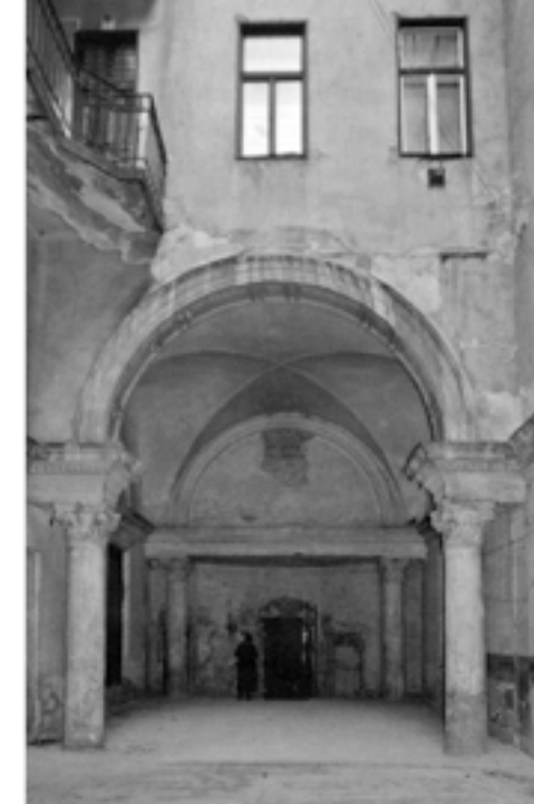
AZ EGYKORI KISMEDENCE TERE