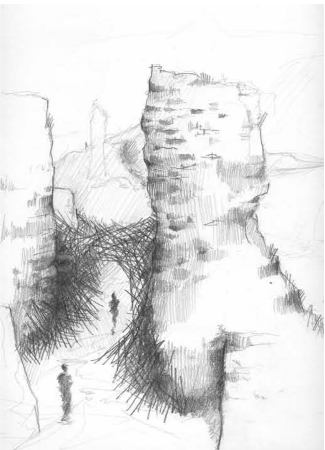
Ratkó József : Déva vára

Kis Déva vára a bokor Épül anyám hamvaiból. Fogytán a könnyem – férfi lettem. Madárka rí, kiált helyettem.