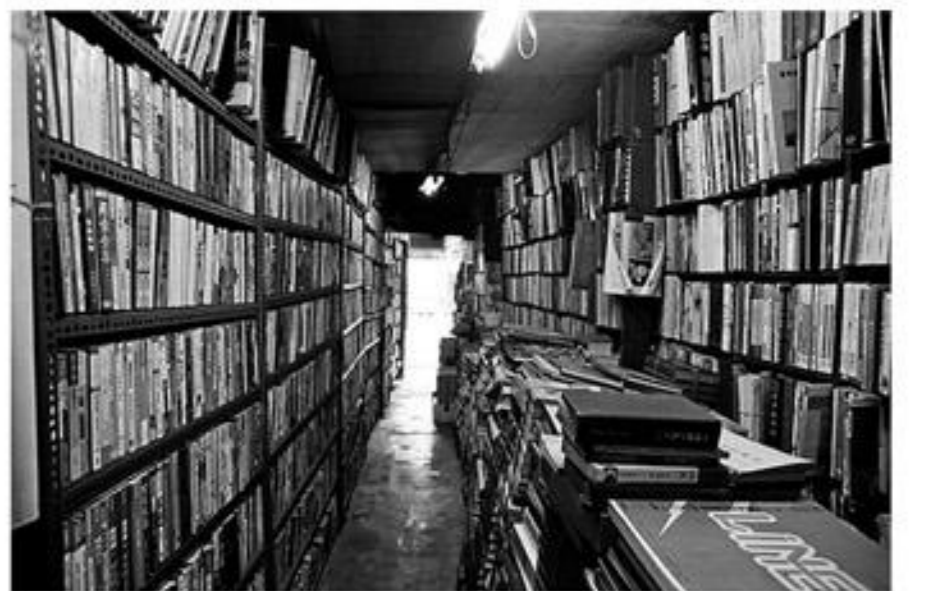
OROSZLÁNY MIKLÓS SZEMÉTHÁZ