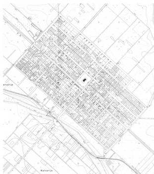
1963-ban készített térkép