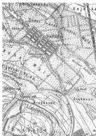
Szilagy, a telepítés után, 1910-ben