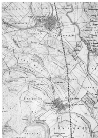
A település előtli képe, 1888-ból