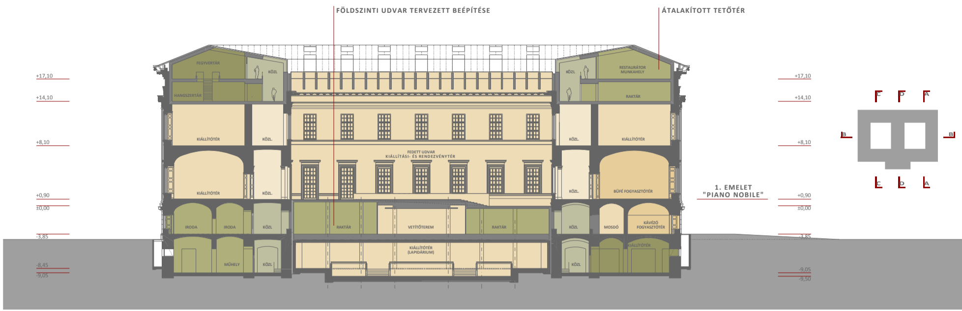
A - A METSZET