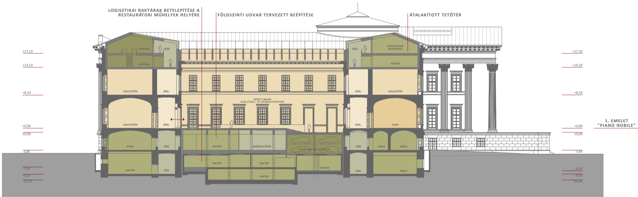
C - C METSZET