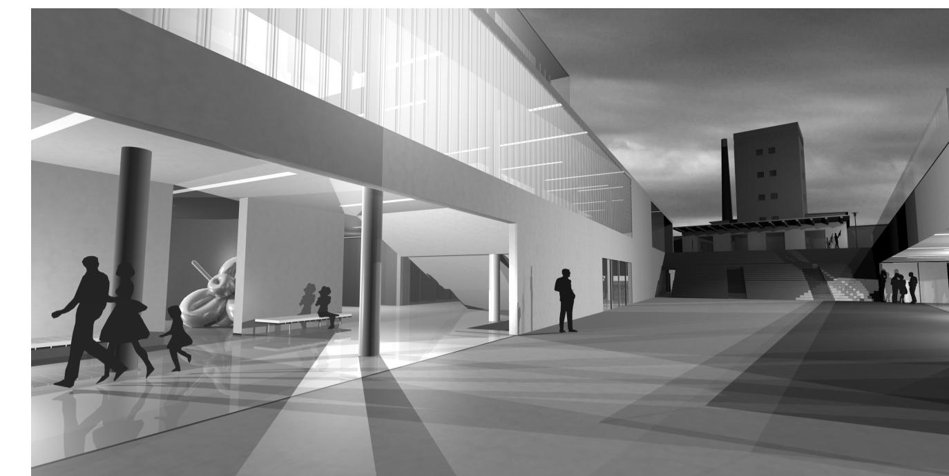
[étteremterasz / szabadtéri kiállítótér]