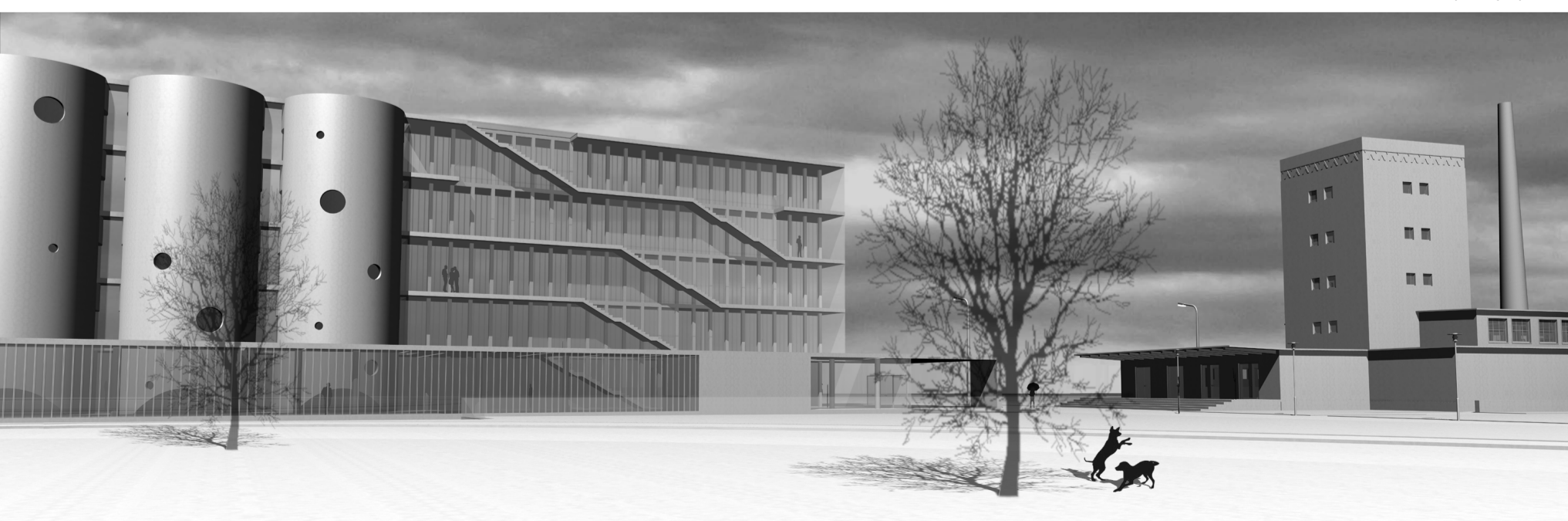
[320° - Csiky Gergely utca]