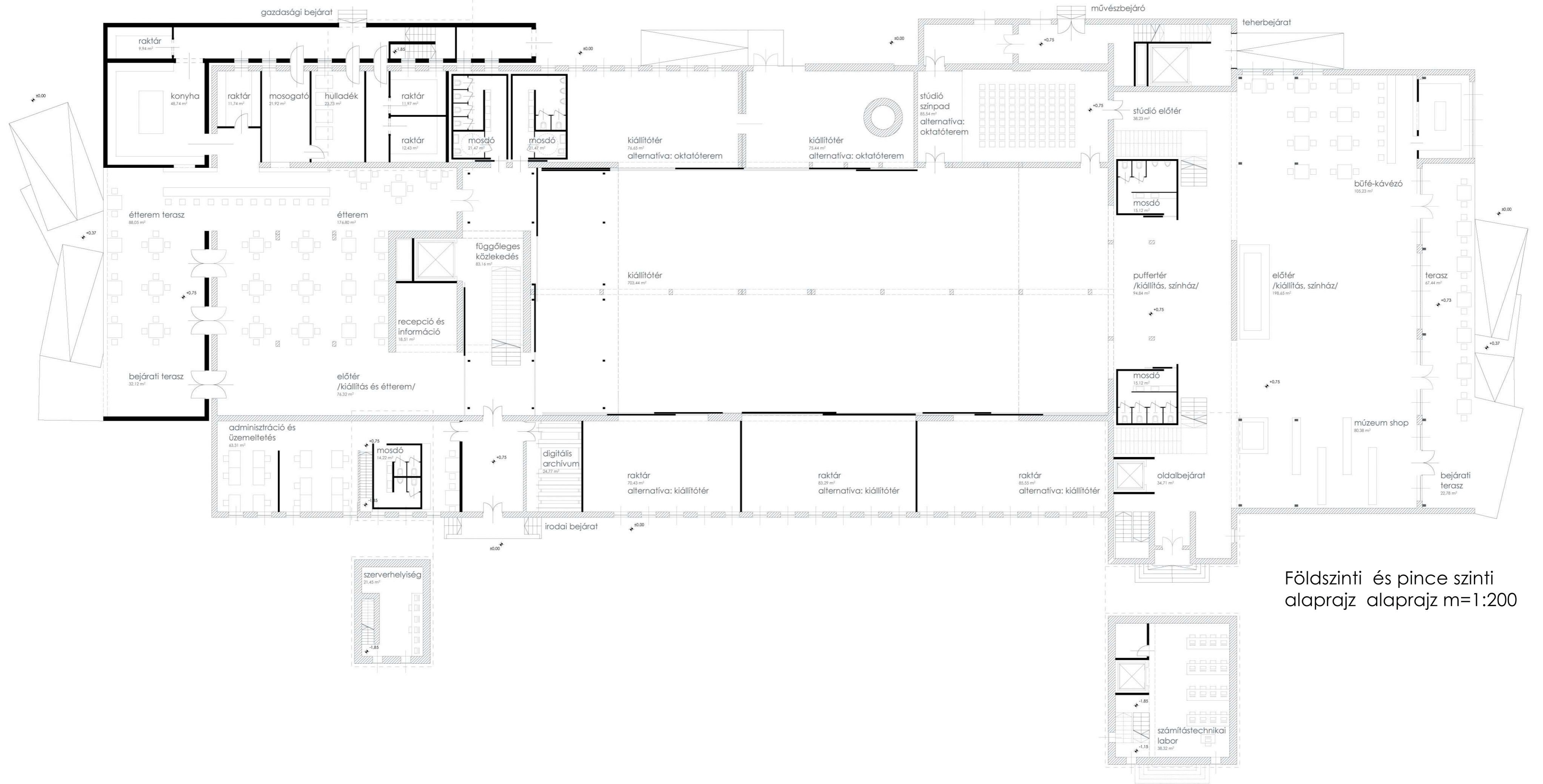
Földszinti és pince szinti alaprajz alaprajz m=1:200