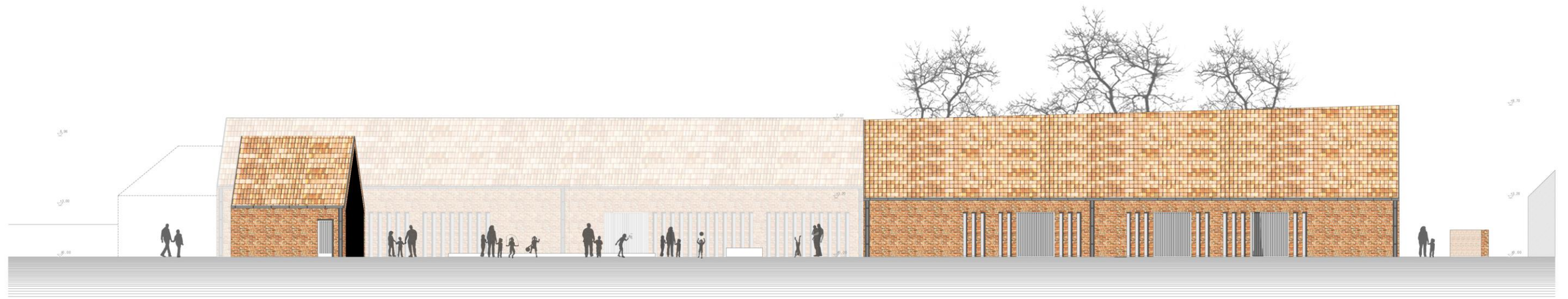
Bolt, Sokadalmak háza nyugat felől