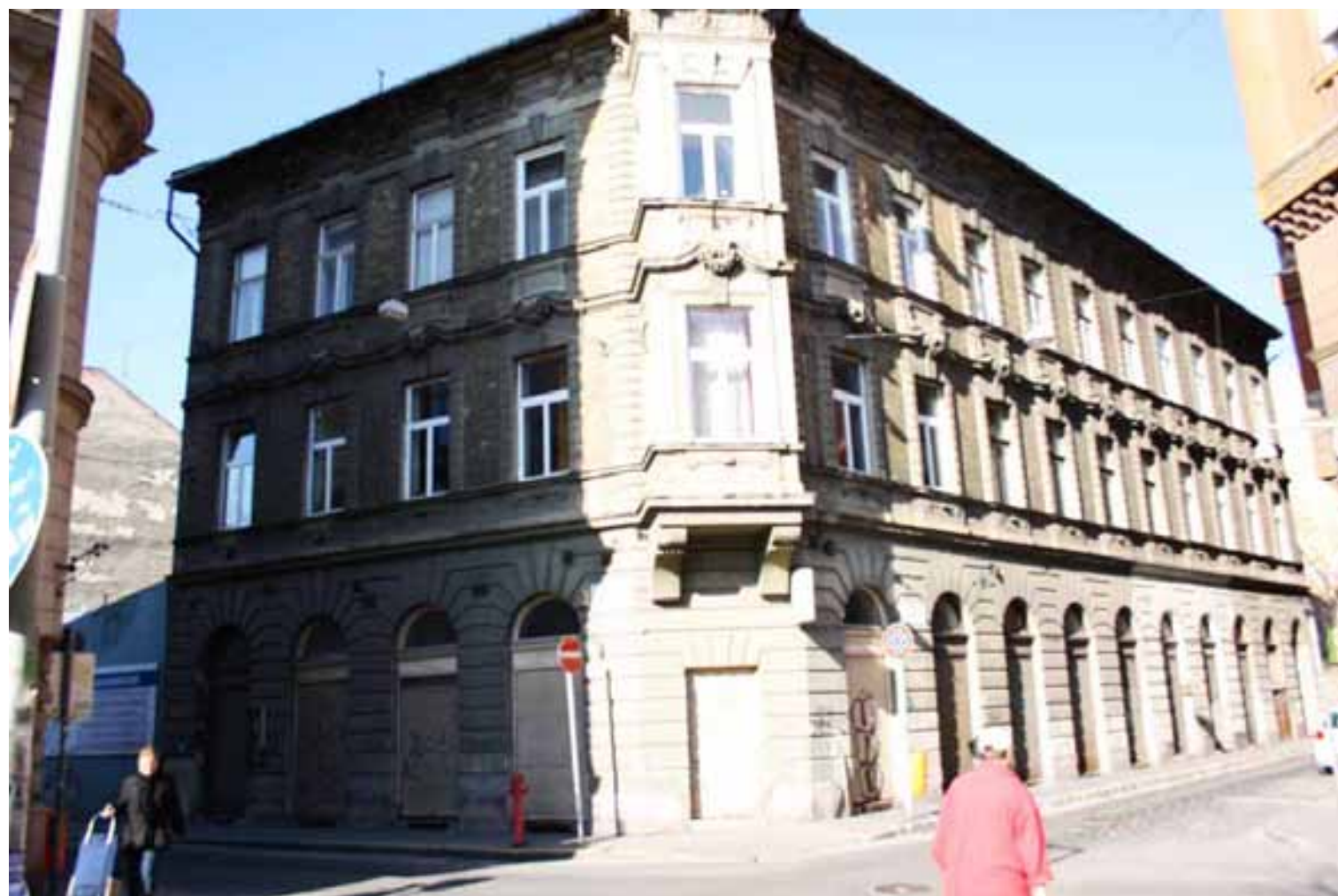
Kisdiófa utca 2.

A BÖSKE elnevezésű civil szerveződést a céllal hoztuk létre, hogy Erzsébetvárost élhetőbbé, szerethetőbbé, emberibbé tegyük a helyi lakosság és mindenki más számára. Rendszeresen jelentkező kulturális és szakmai programokkal, lokális megmozdulásokkal, nyilvános beszélgetésekkel, workshopokkal tesszük még vonzóbbá Budapestnek ezt a történelmileg is meghatározó városrészét. Célunk a helyi hagyományok újjáélesztése és az emberek közötti kommunikáció felerősítése. Hosszú távon összetartó és környezet tudatos közösség létrehozásán dolgozunk, akiknek fontos, hogy részt vegyenek a kerület mindennapjaiban, és közösen tegyék Erzsébetvárost minden mástól megkülönböztethetővé, egyedivé. A városrész rehabilitációja, és a rendezvények kialakítása során ugyanúgy odafigyelünk az idős korosztály igényeire, mint a fiatalok felvetéseire. A BÖSKE ernyője alatt lehetőség nyílik az itt élő emberek elképzeléseinek megfelelő valós eredményeket elérni. Felmerjük, összefogjuk, és érveket, érdekeket, összehangolt kommunikációval jelenítjük meg a döntéshozatal minden szintjén. Kiemeljük és megfogalmazzuk a kerület értékeit turisztikai és urbanisztikai szempontból, és hozzáértő szakmai támogatással segítjük a lakosságot, a helyi civil szerveződéseket, valamint a tradicionális kisvállalkozásokat, mesterembereket, kereskedelmi egységeket, a városrészben alkotó kortárs művészeket, és a lakókörnyezet tudatos, felelősségteljes használatát elősegítő aktivitásokat.