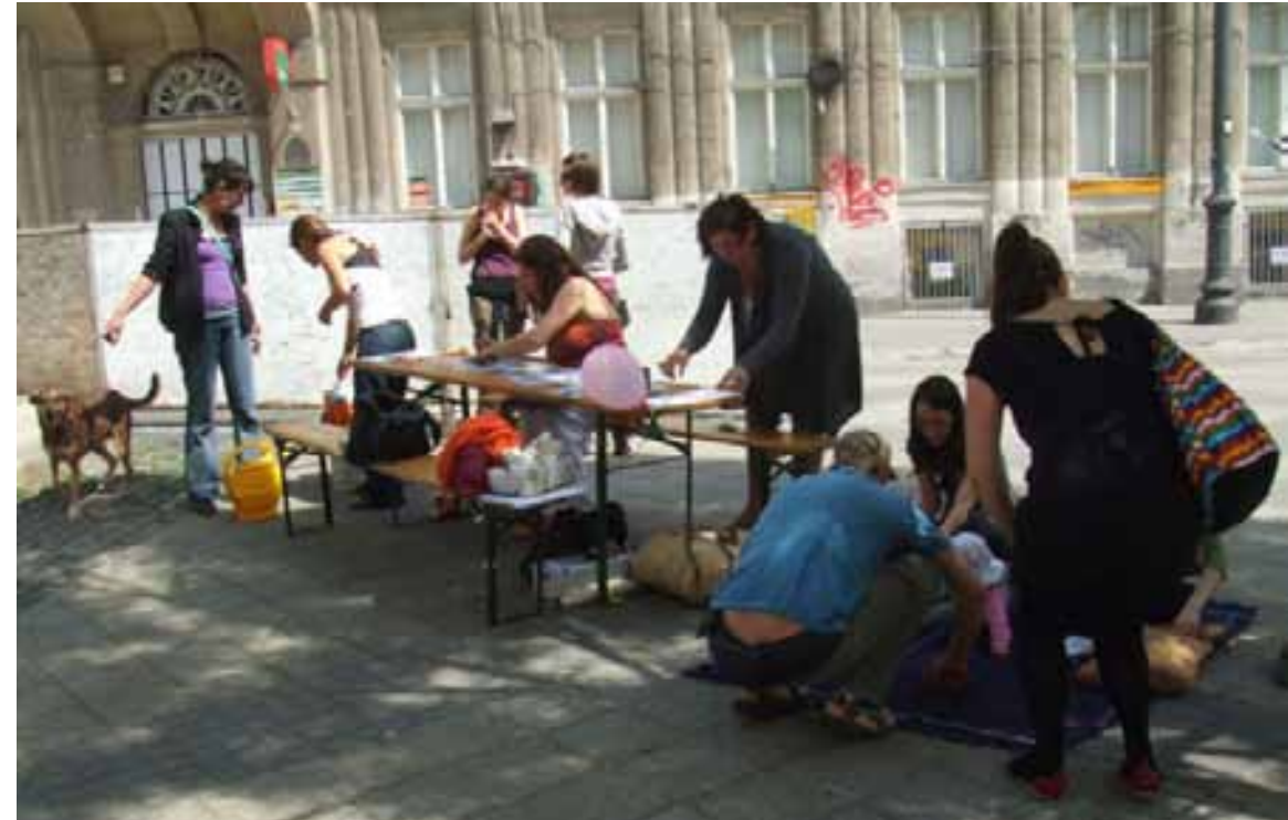
a Böske a Civil Majálison