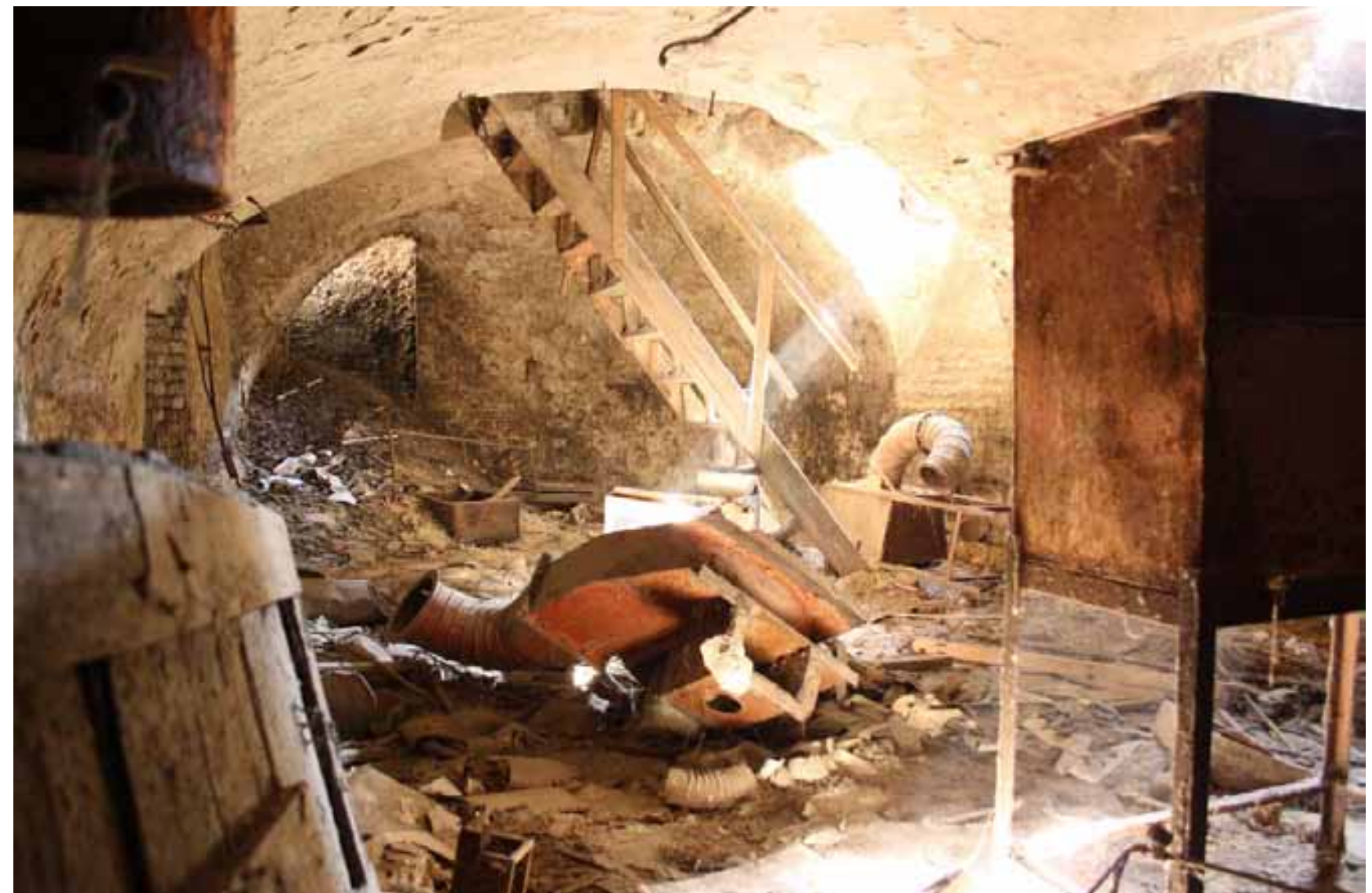
a Kisdiófa 2. csodaszép pincéje