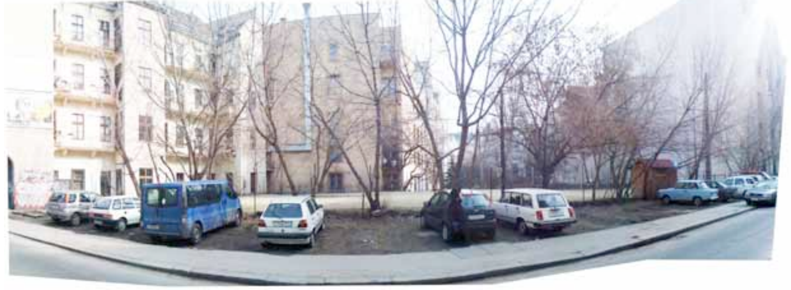
a 15-ös tömb a foghíjon keresztül