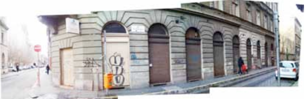
a földszinti üresen álló üzletsor!