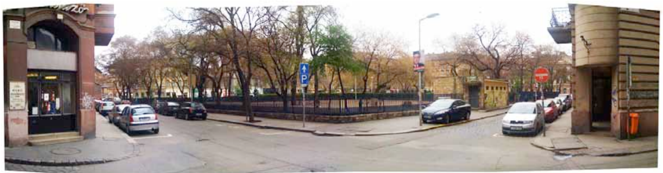
Klauzál tér a sarokról