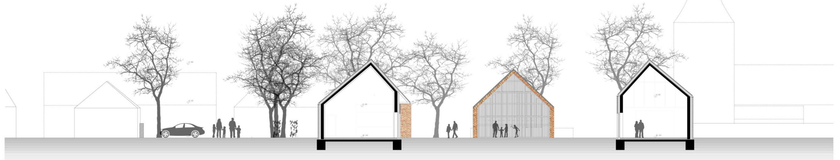
Bolt köz felőli homlokzat