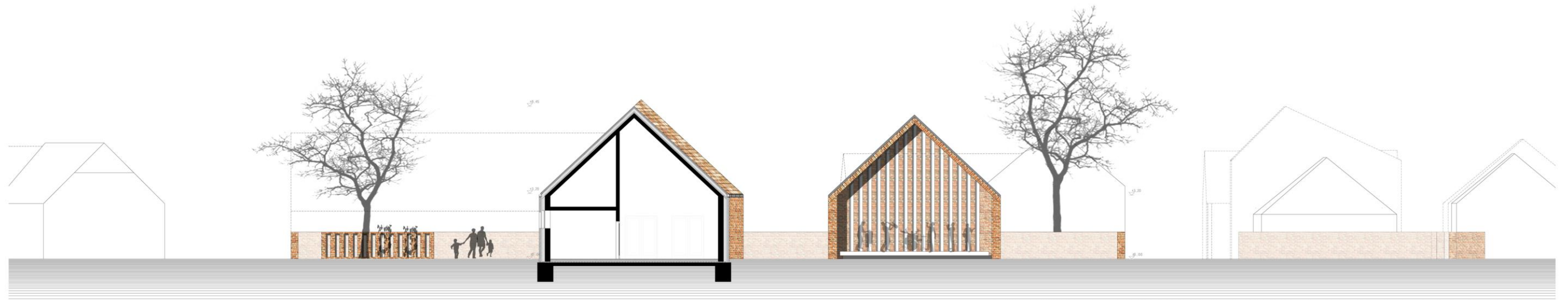
Pajta Szín-tér felőli homlokzat

anyagok: téglaburkolat (TERCA 12 cm víg) cserép (Tondach tatali hódfarkú húzott cserép 19+40 cm) fa (5+5 cm lécs felületkezeléssel) fém ereszcatorna (rozsdamentes acél antracit színűre mázolva)