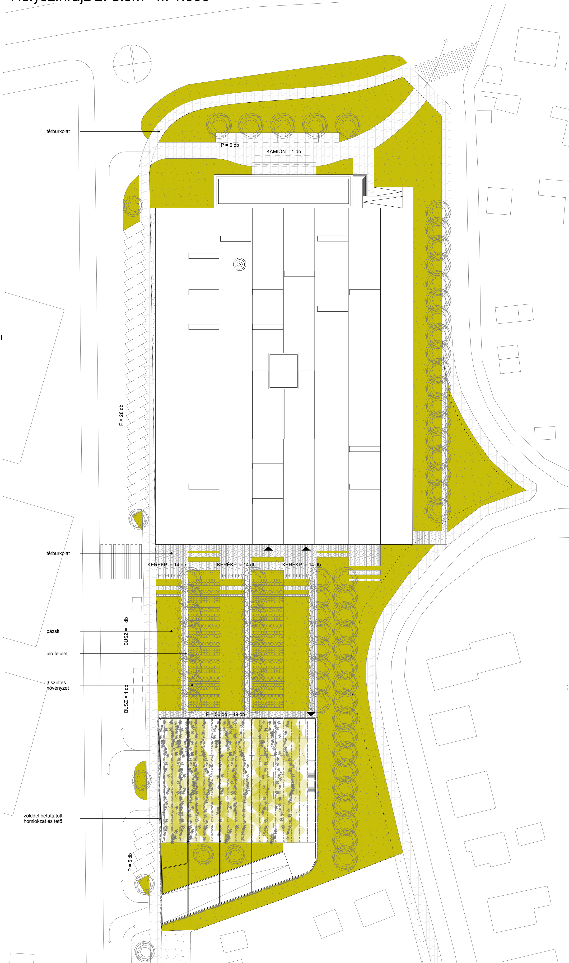
Helyszínrajz 2. ütem M 1:500

A 2. ütemben megépülő parkoló lemezt acél és vb. vázrendszer határolja, illetve részben zárja felülről, melyet növényzettel futtatunk be. Ily módon a kertbe épített transzparens elem (tárgy) kerti jelenségként, a ház kerti párjaként értelmezhető.