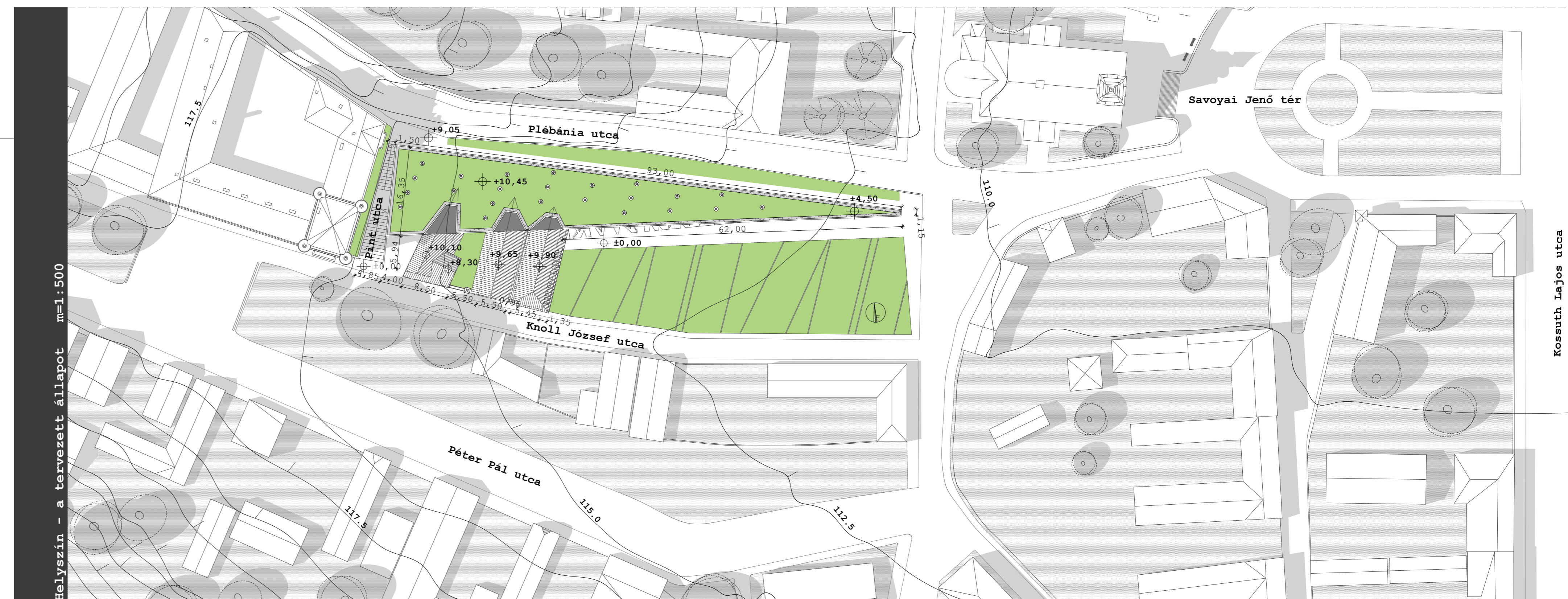
Helyszín - a tervezett állapot m=1:500