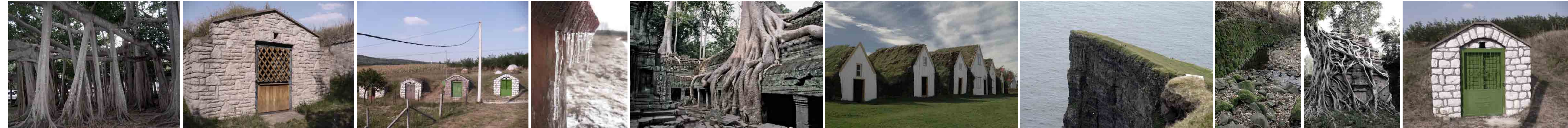
Előképek a világ körül