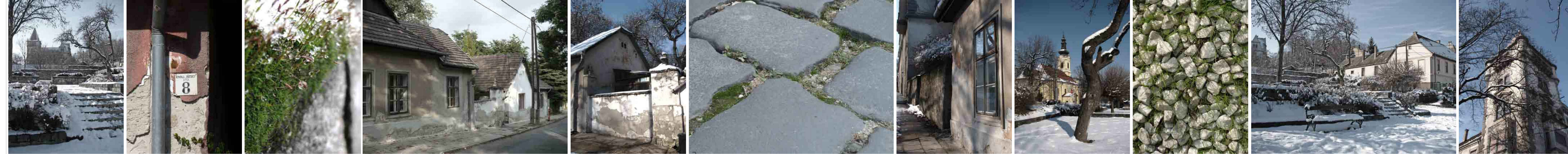
Fotók a helyszínről