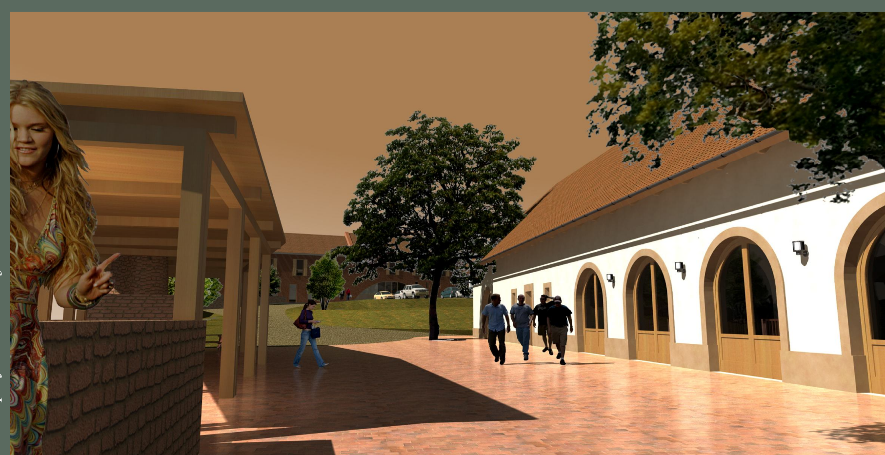
Artem pályázati munkája