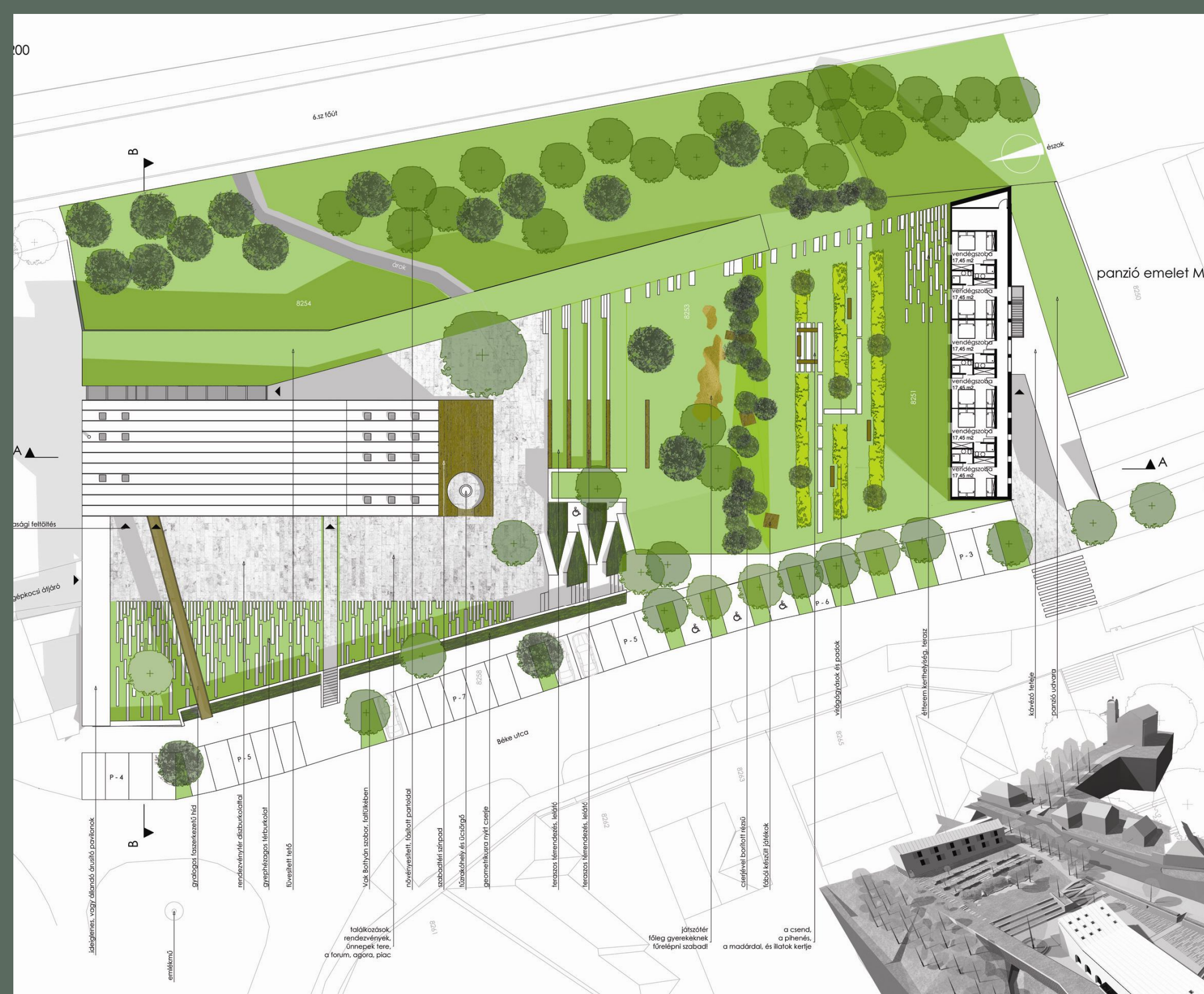
Czita pályázati munkája