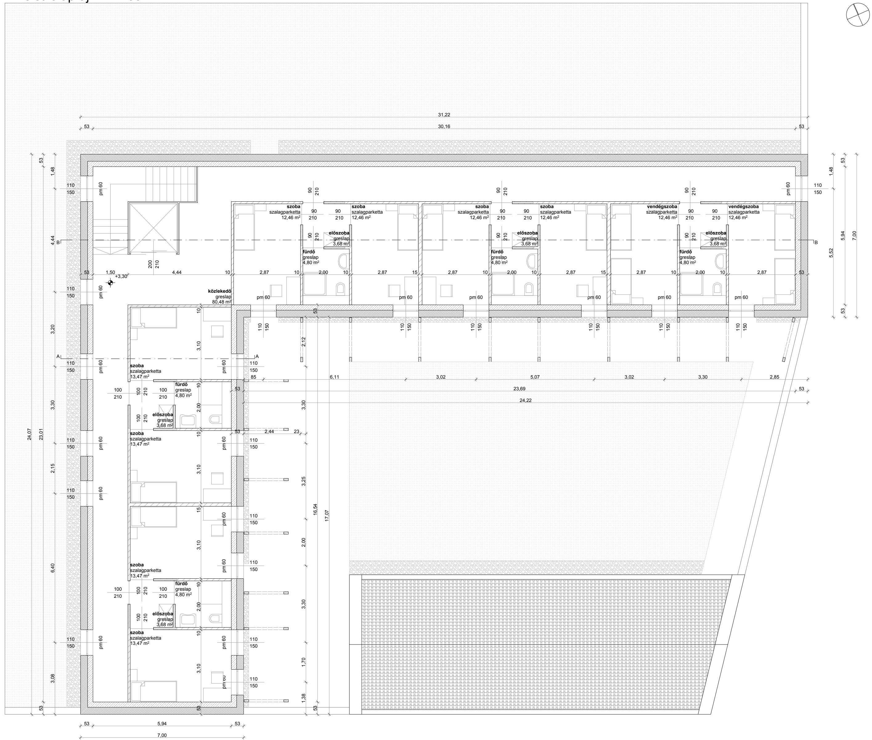
Emeleti alaprajz M1:100