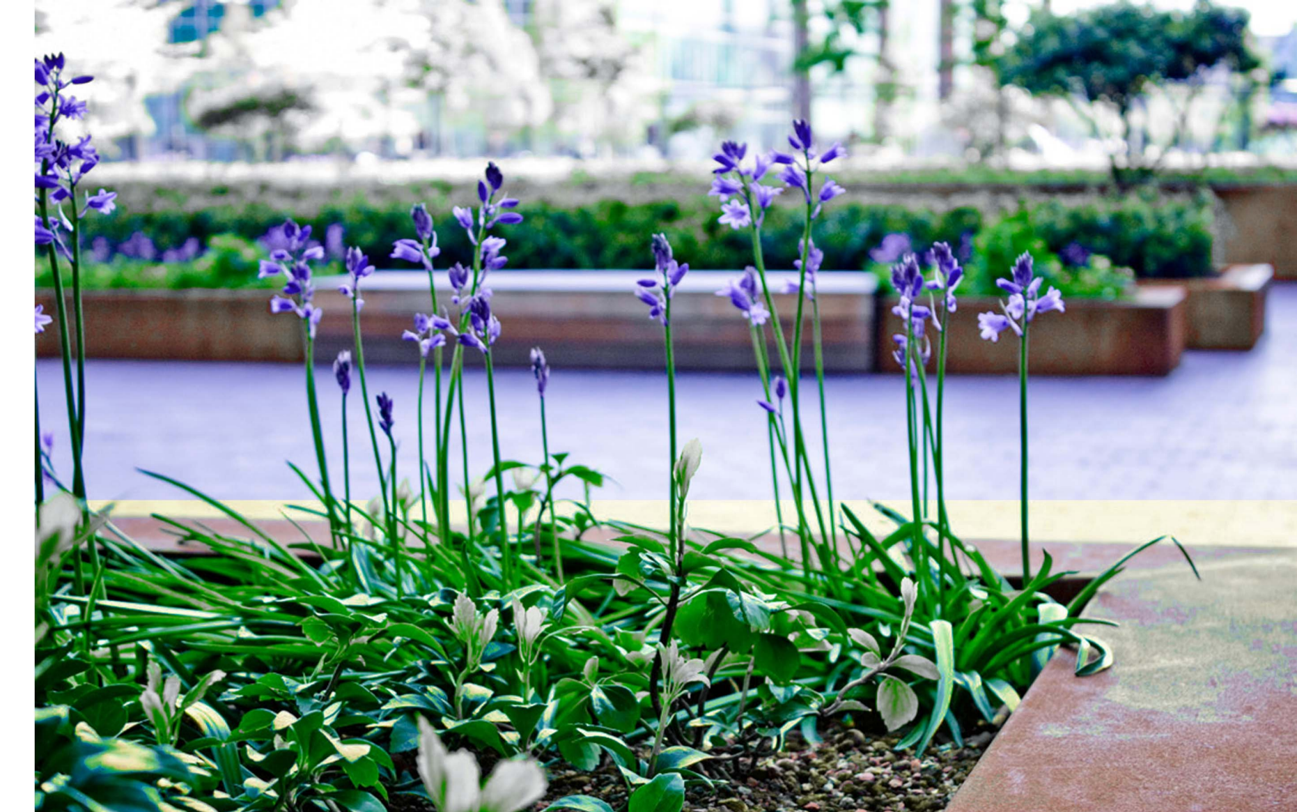
Az építészeti alapkonceptió

Az építészeti tervezésben az irányadó az volt, hogy Újpalota Főtere az itt lakók számára is jól használható találkozási pont legyen, ezen belül a legfontosabb feladatnak egy tényleges városi tér kialakítását éreztük. A lakótelep jelenleg is hatalmas zöld felületekkel rendelkezik, ezért a főtér átalakításával nem elsősorban a pihenés funkcióját, hanem a mindennapi városi élet keretétől szolgáló városközpont kialakítását jelöltük meg célként. Mivel a jelenlegi növényállomány túlsúlyos, előregedett és rossz térszerkezetű, ezért komolyabb átalakításra szorul.