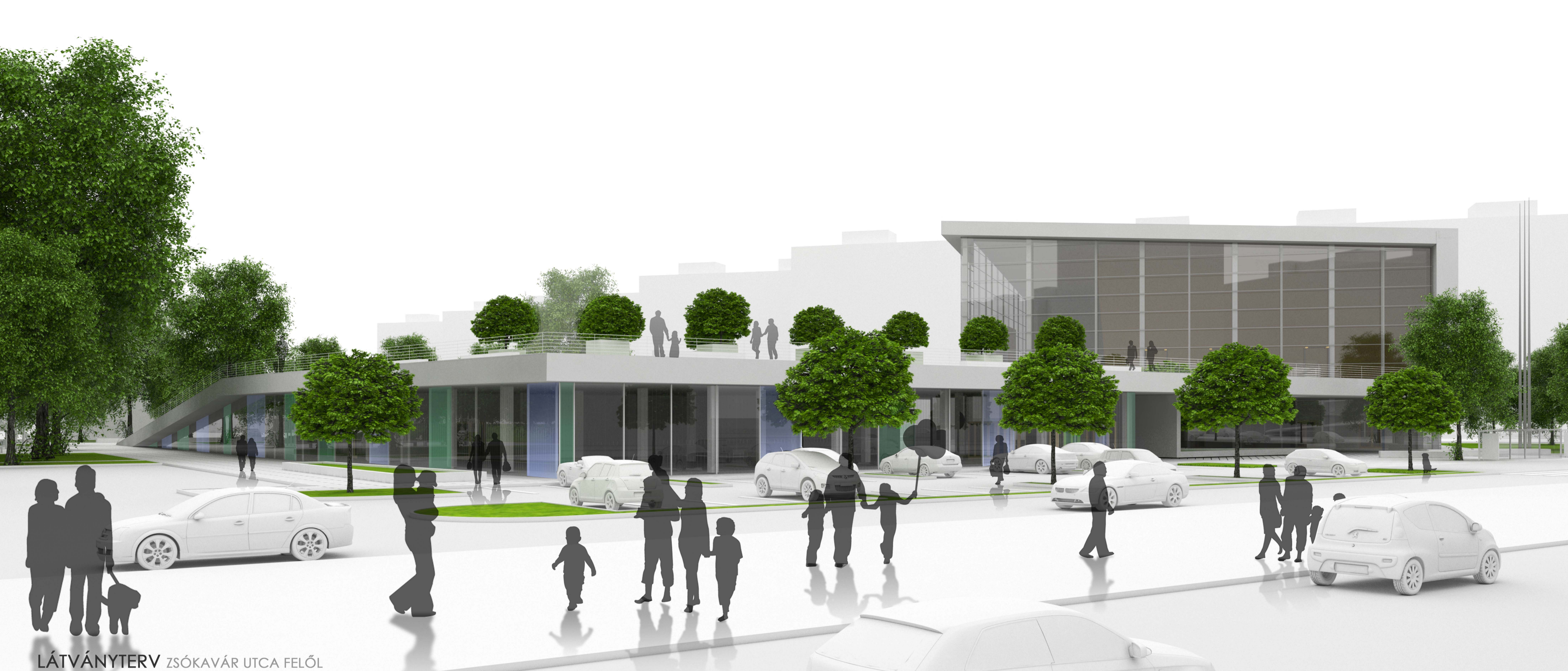
LÁTVÁNYTERV ZSÓKAVÁR UTCA FELŐL