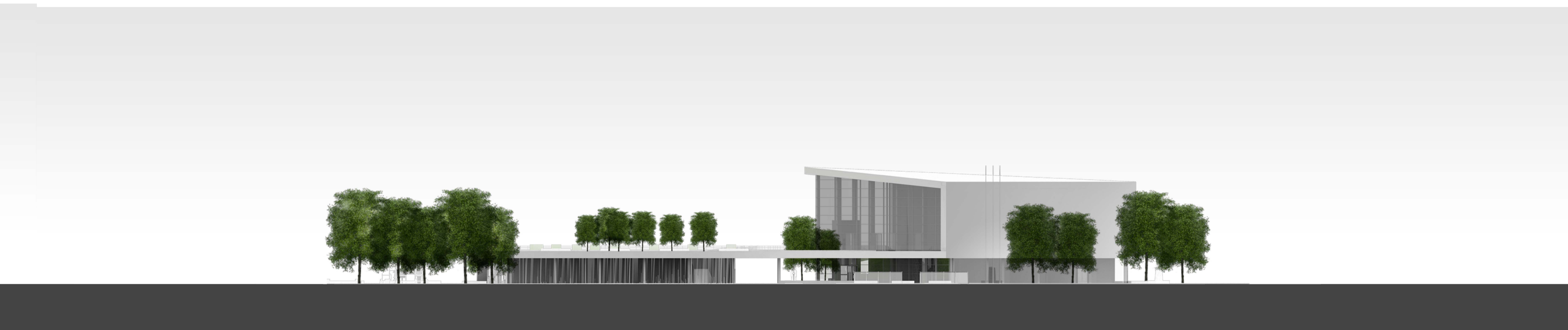
ZSÓKAVÁR UTCA FELŐLI HOMLOKZAT 1:200

Az emeleti homlokzatok üvegburkolata kéthéjú homlokzati üvegezés, klíma homlokzat, mely kiegészül a két héj között állítható, külső árnyékolással. A külső héj alsó és felső részén a homlokzat teljes hosszában motoros vezérlésű lamellák kapnak helyet.