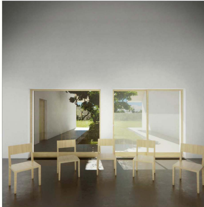
Közösségi terem látványterve