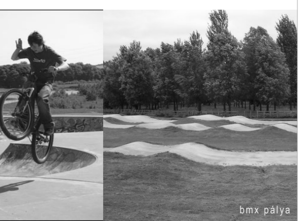
gördeszka pálya, kosárlabda pálya, bmx pálya