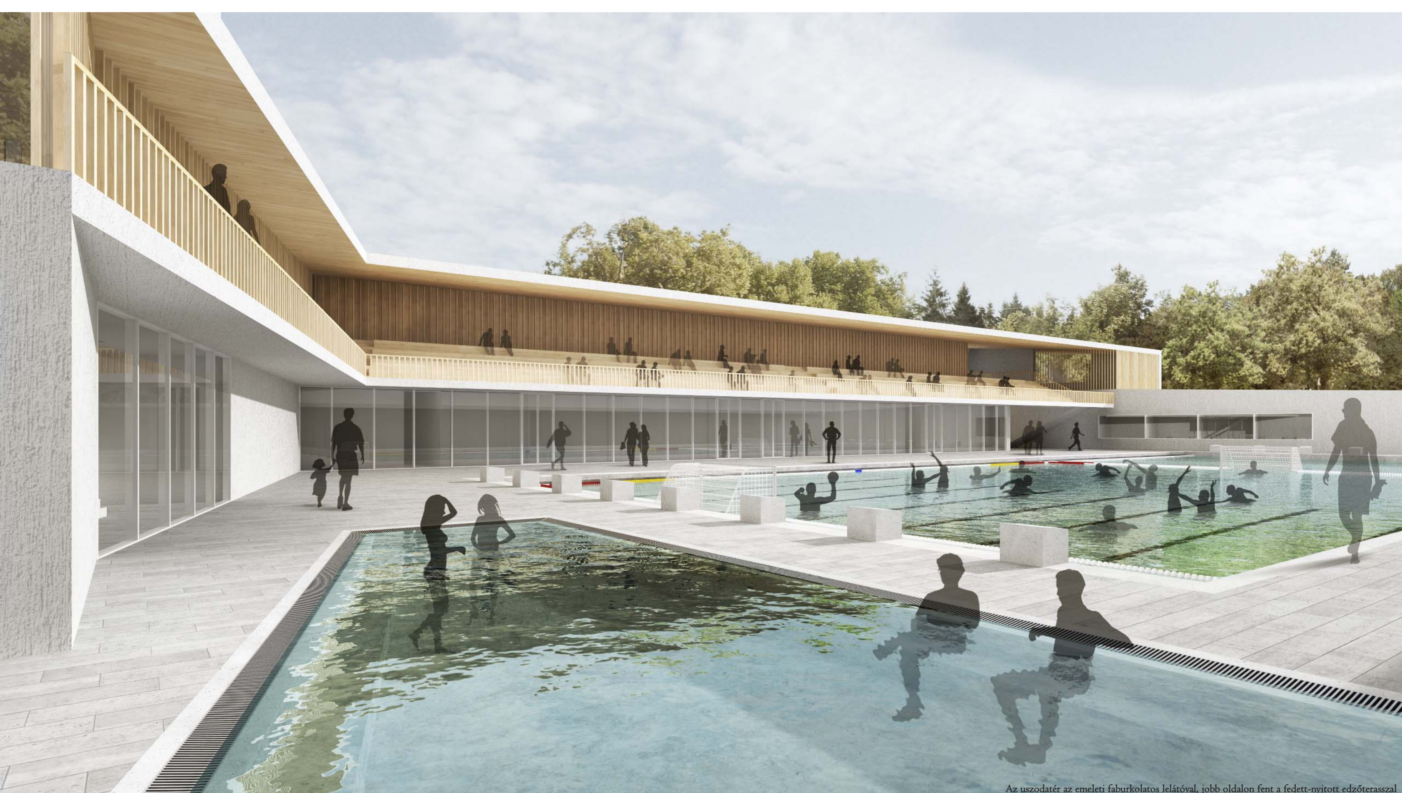
Az uszodater az emeleti faburkolatos lelátóval, jobb oldalon fent a fedett-nyitott edzőterasszal