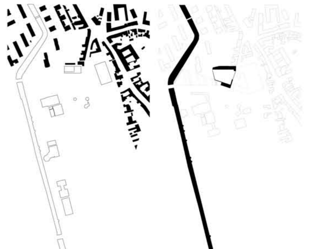
észak-déli tengely - határvonal a lakóövezet és a fürdőterület között nyugati-keleti tengely -patak-köztér-ház

A Bányászat uszoda elhelyezkedése a városban különleges jelentőségű. Egyértelmű határhelyzetet foglal el a város és a fürdőkerület között, ezen az észak-déli tengelyen a városból érkező látogatók számára tulajdonképp a fürdőterület kapuját adja. Ez a jól érzékelhető váltás azonban a hosszútávú tervekben is megmaradó Frank Tivadar utca jelentős forgalma miatt megtörik (épp ebből adódik a Bitskey uszoda tévedése, mely monumentálisával épp egy használhatatlan terület felé nyit következtlenül). A helyszín jól látható lehetősége ugyanakkor, hogy ezt a kapu-helyzetet egy új beépítéssel kiegészíti nyugati irányban egészen a patak medréig. Így a Bányászat sávjában létrejöhet egy új, képzeletbeli kelet-nyugat irányú köztéri tengely, mely az uszodával együtt képes megnyitni a fürdőkerületet.