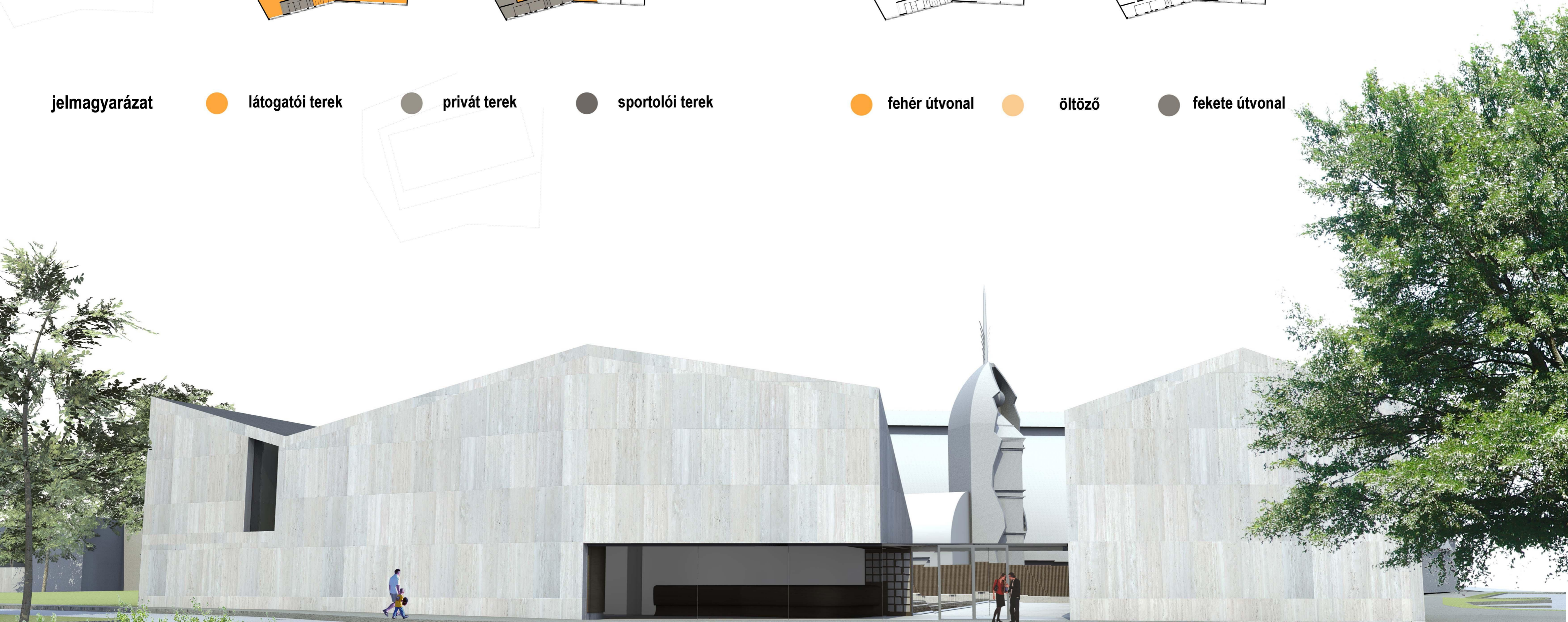
látványterv a Bitskey Uszoda tornyára tájolt bejáratról az új Kerengő téren keresztül