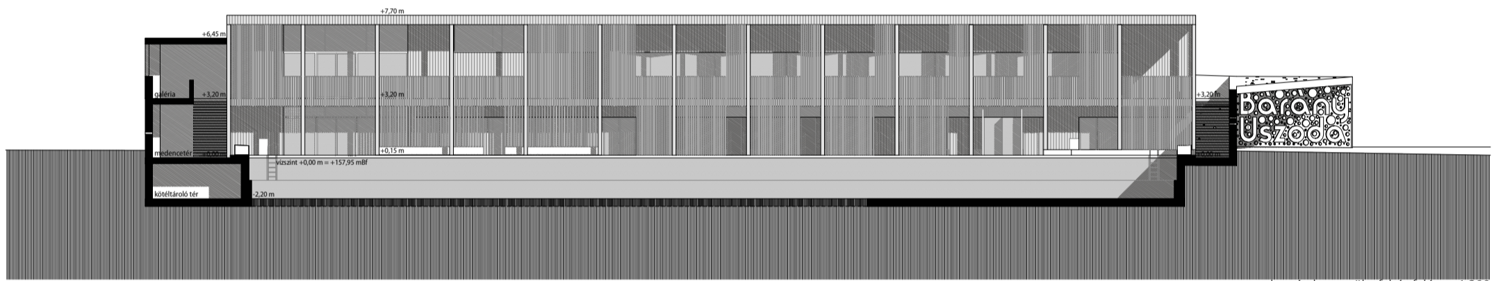
metszet a medencén keresztül a faház felé m=1:200