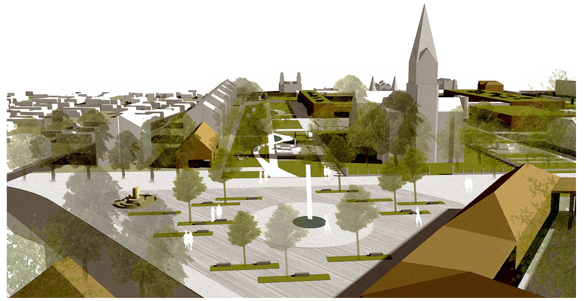
az új Főtér és a Sétatér a Nagytemplommal