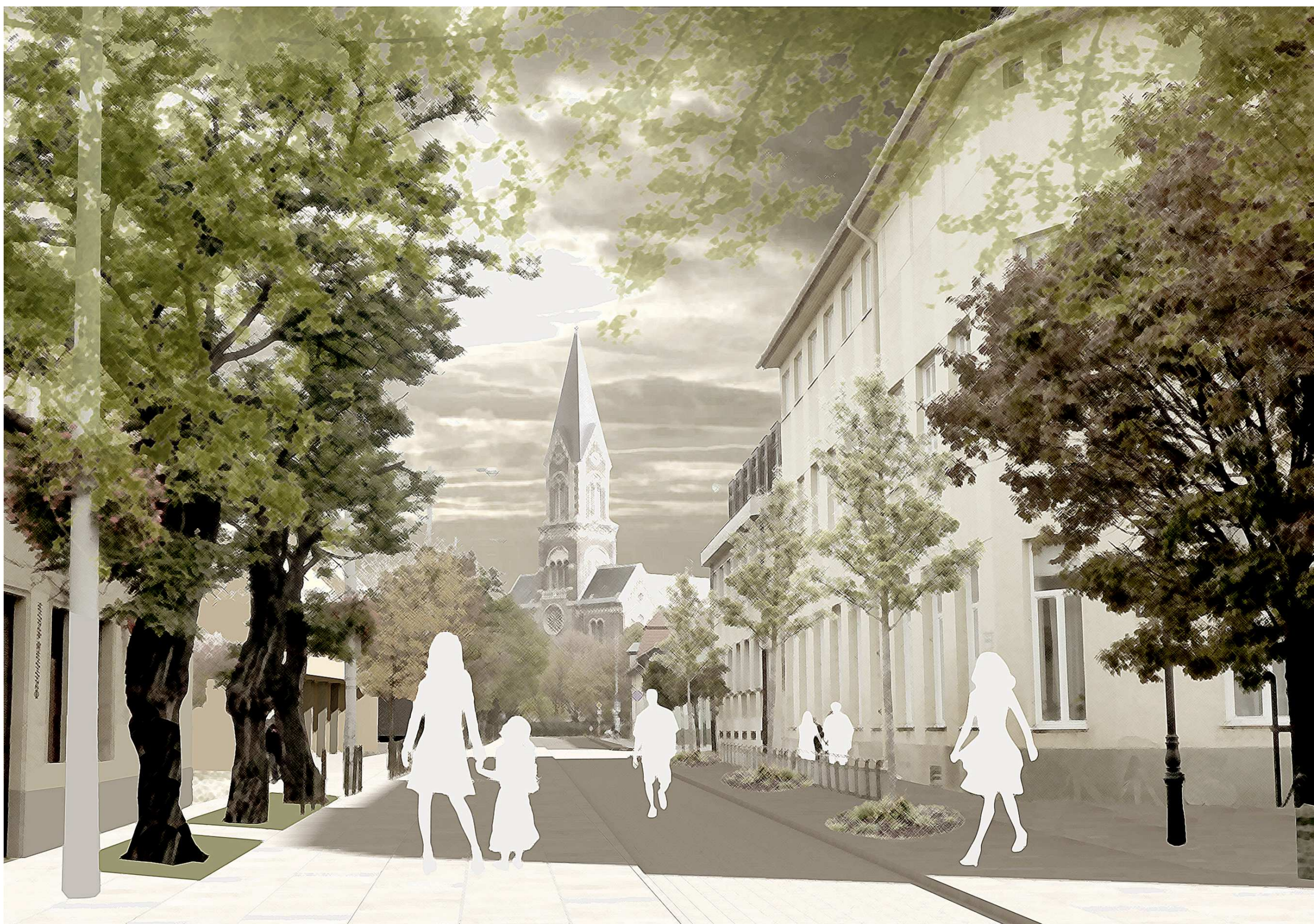
a Bácska utca, a leendő sétálóutca a Nagytemplommal