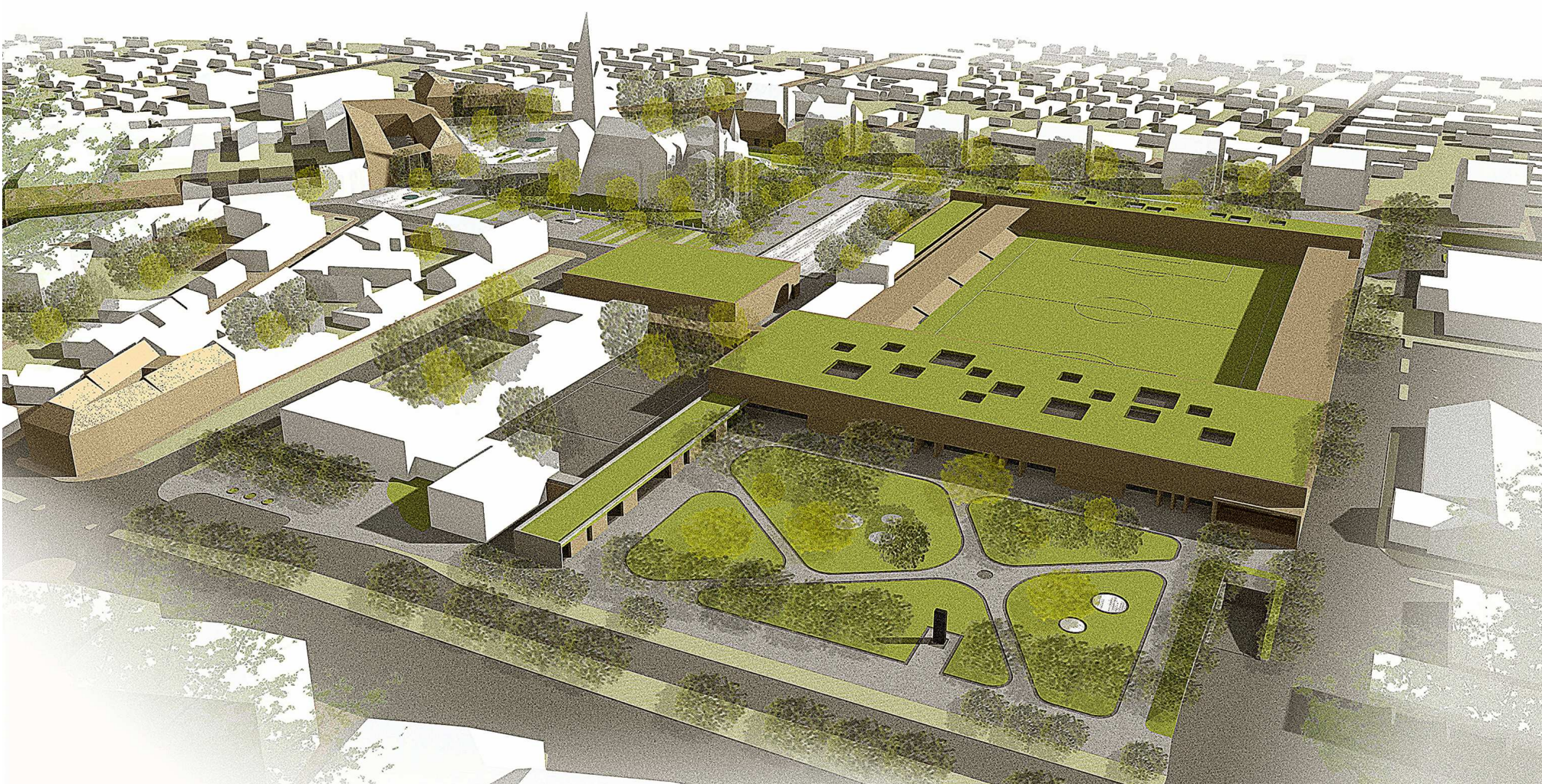
a sportközpont, háttérben az új Főtérrel és a Nagytemplommal