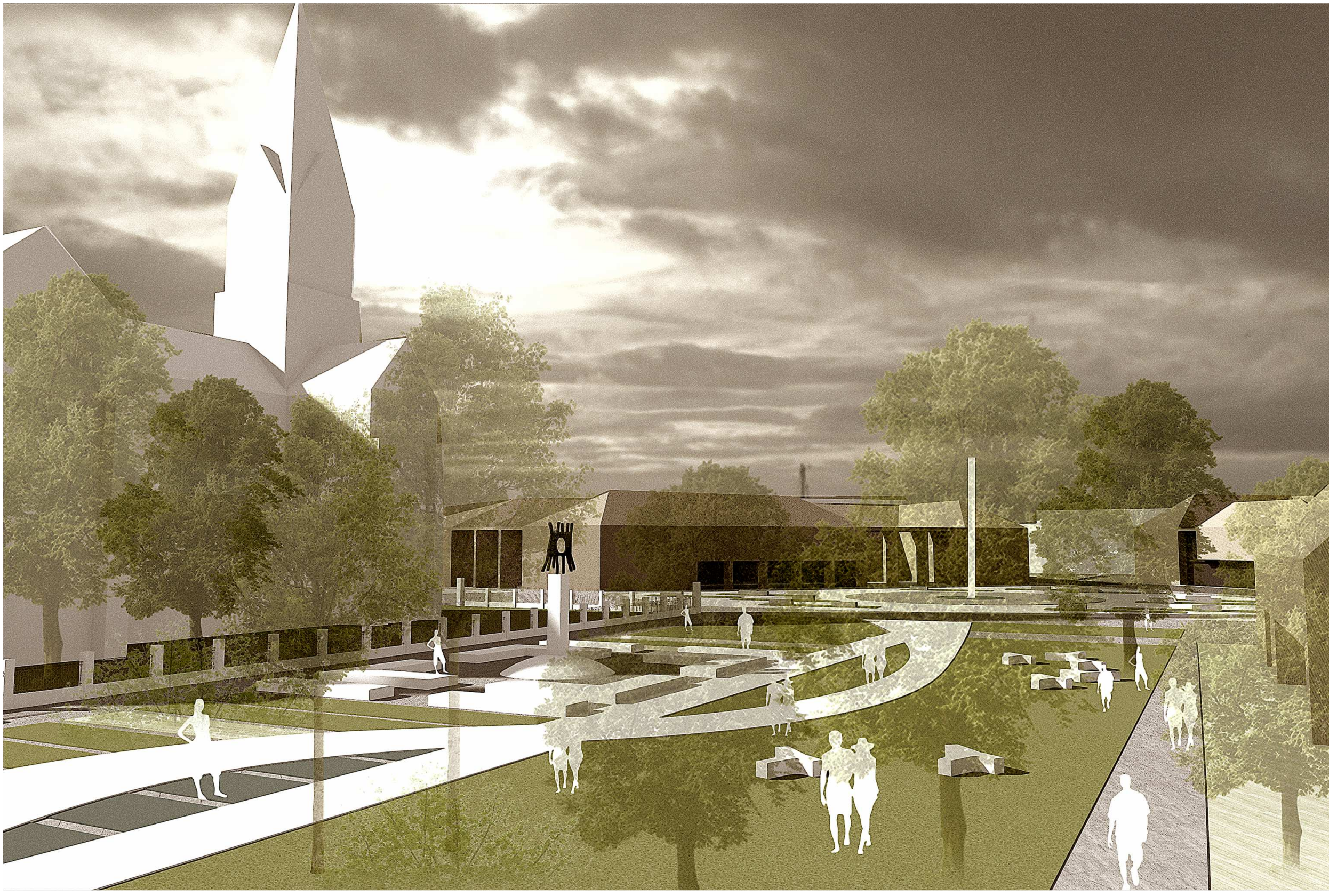
a Sétatér az 56-os szoborral, háttérben az új polgármesteri hivattal