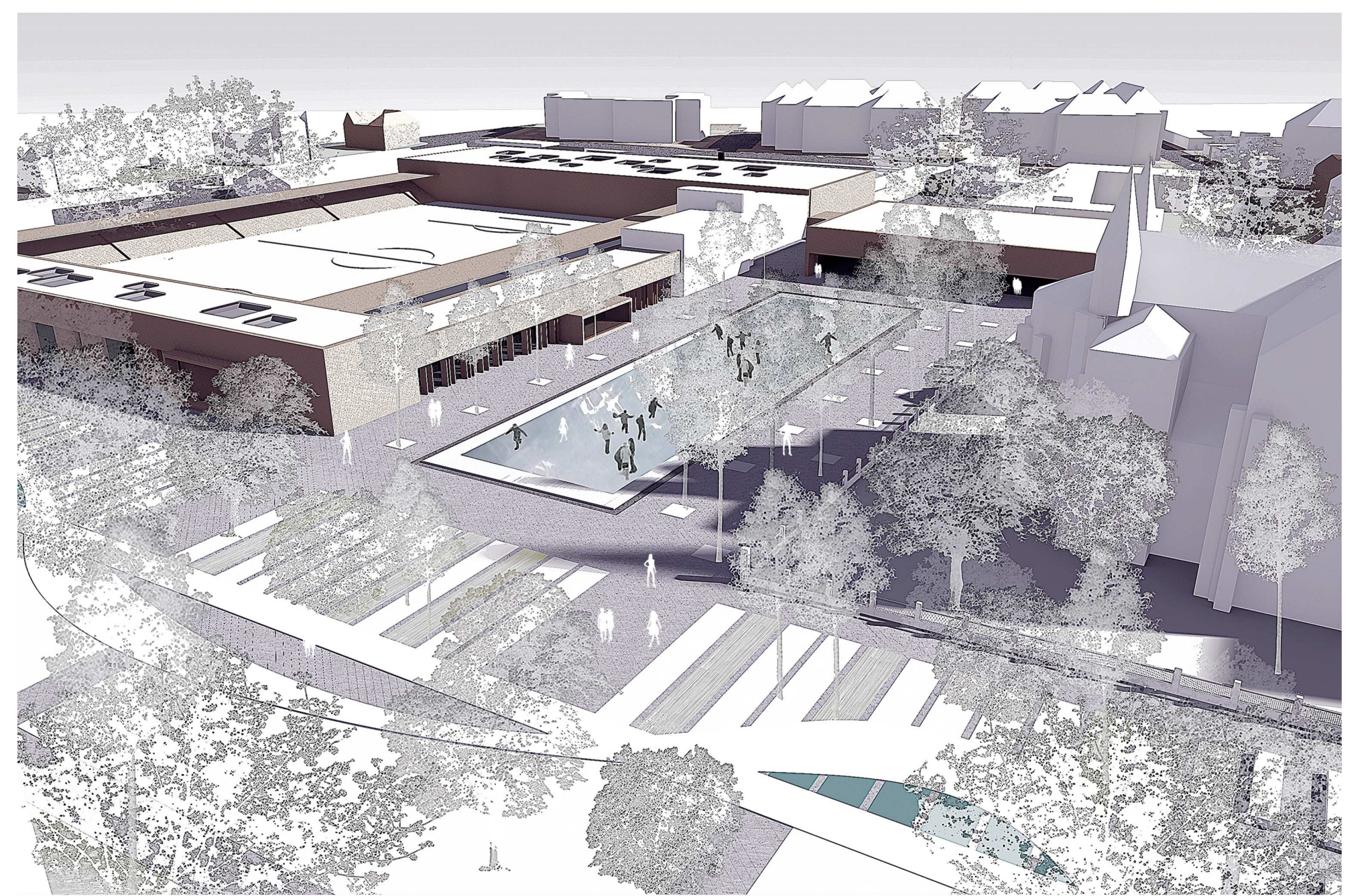
rendezvénytér téli használata