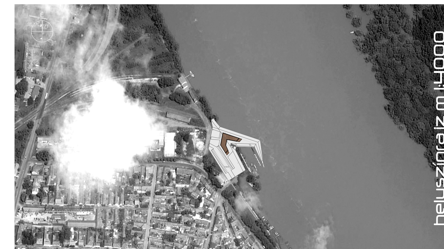
helyszínrajz m 1:4000