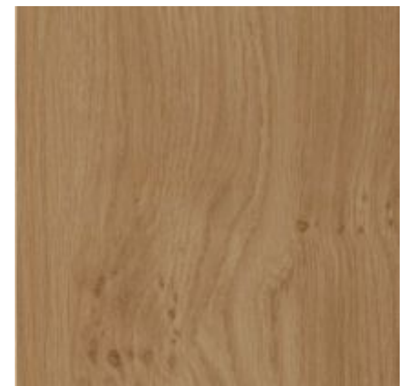
tölgy rétegelt lemez burkolat, viaszolt