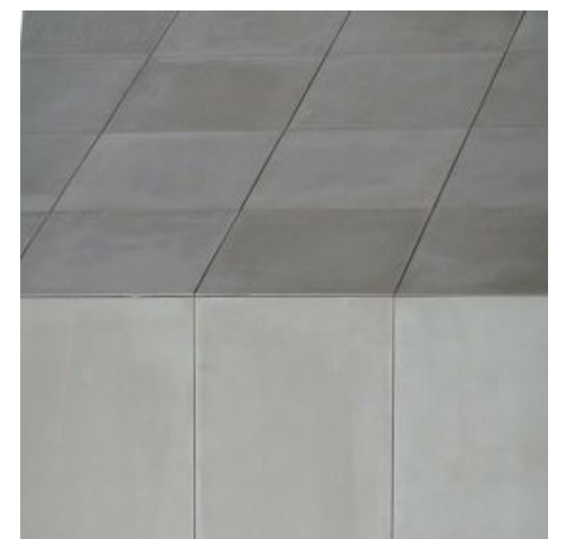
szerelt táblás beton burkolat

átszellőztetett homlokzat, szerelt, táblás fehér beton burkolat szerelt rétegelt lemez burkolat, tölgy, viaszolt látszó beton perforált válaszfal hőszigetelő simított vakolat, páraáteresztő sárga festés fa nyílászáró, sötétbarna lazúr égetett kerámia cserépfedés ragasztott táblás fehér beton burkolat átszellőztetett homlokzat, szerelt, táblás fehér beton burkolat